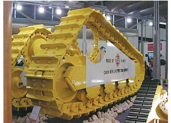
⇨ 大型ブルドーザ用アンダーキャリアッジャSSY