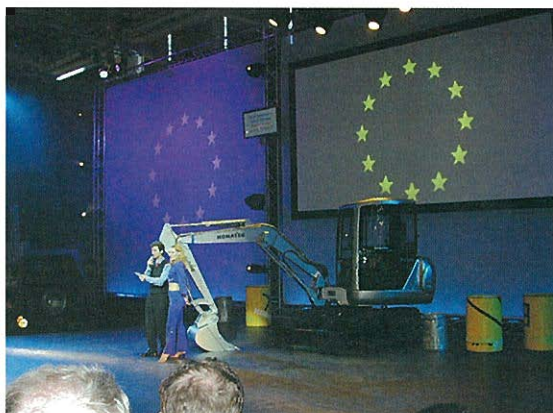
⇩デモンストレーションステージ