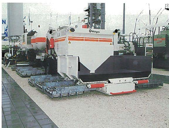
⇩サーフェスリサイクル舗装機械