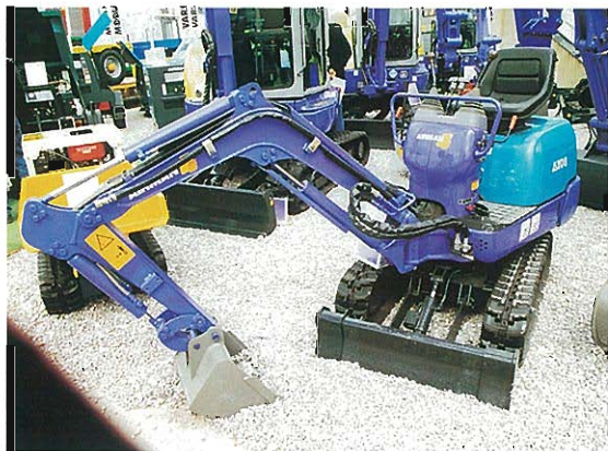
⇩ミニ・エクスキャベータ