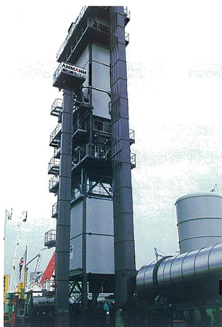
⇩アスファルト合材プラント