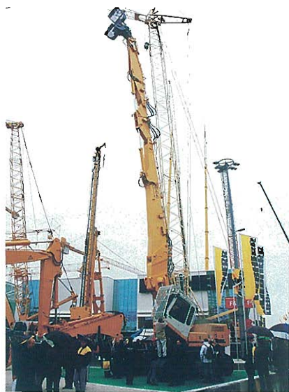
⇩ロングブーム、傾斜キャブ 特殊アタッチメント