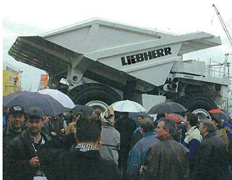
⇩大型ダンプトラック