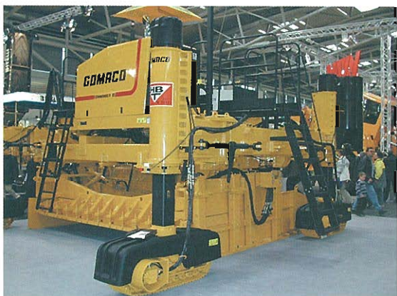
⇩コンクリートスリップフォームペイバ