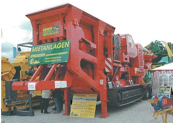
⇩大型移動クラッシャ