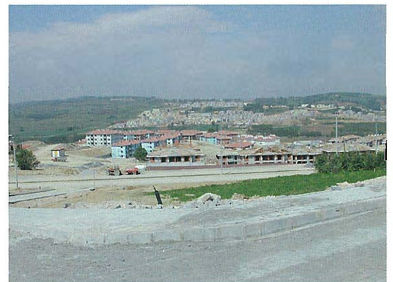
⇨ トルコ・アダバサル地震災害地 新都市移転計画