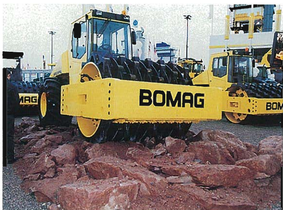
⇩岩石用コンパクタ