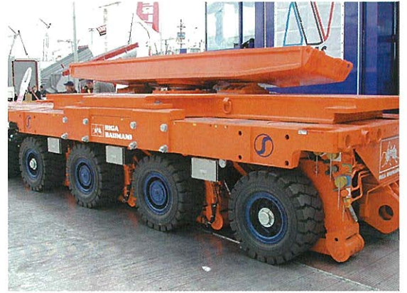
⇨ 大型車輛運搬トレーラ