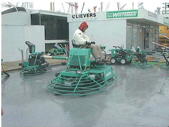
⇩コンクリート床仕上げ機