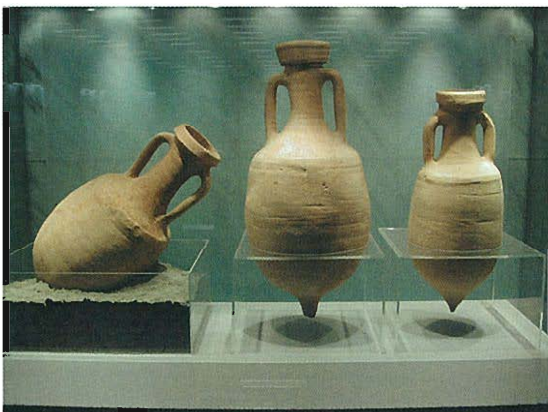
⇨ アテネ地下鉄工事発掘古代ギリシャ遺品のツボ (地下鉄駅コンコースに展示)