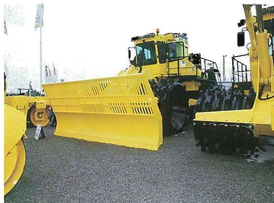
⇩ブレード付コンパクタ