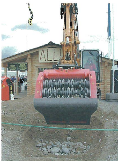
⇩ストーンピッキングアタッチメント