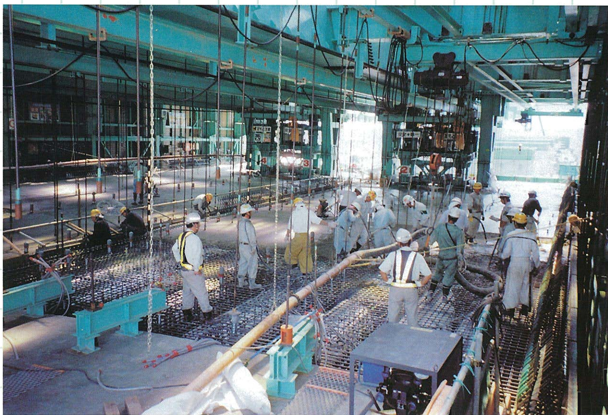
⇩コンクリート打設状況