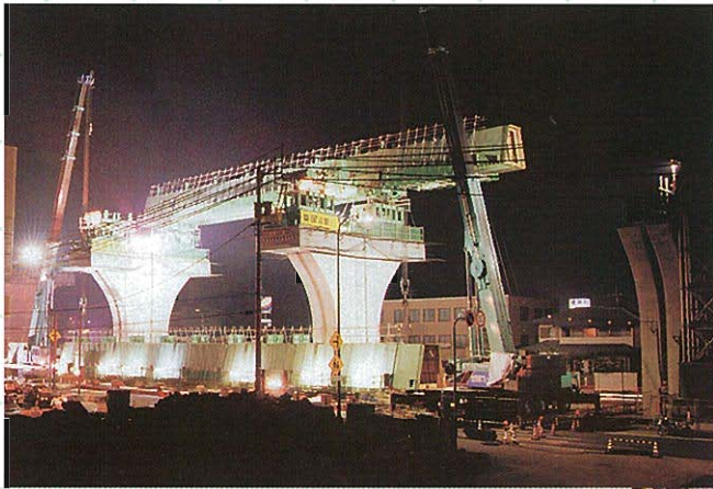
⇩200tクレーン2台による夜間ガーダー架設状況