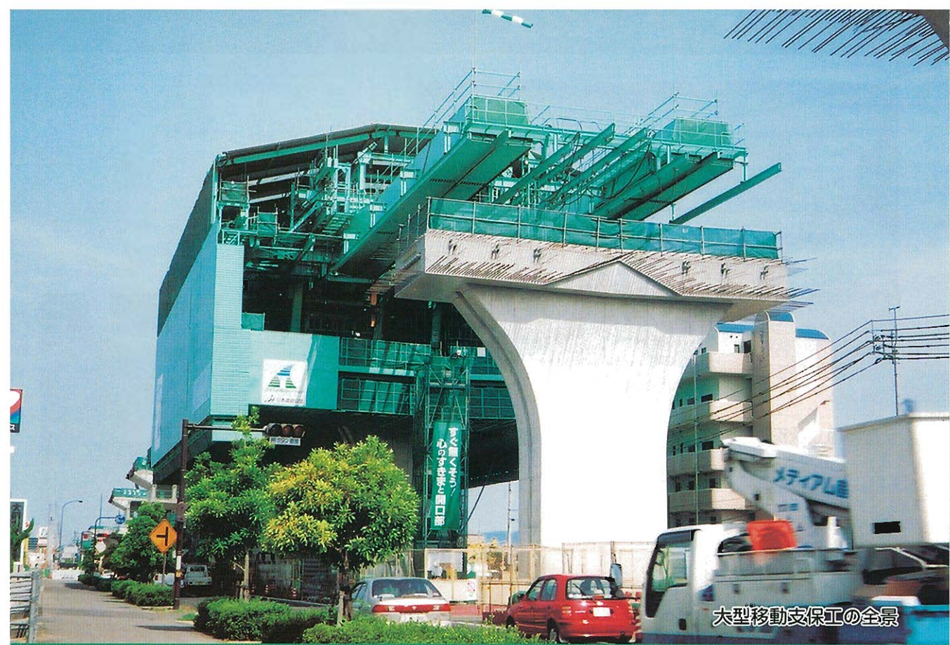
大型移動支保工の全景