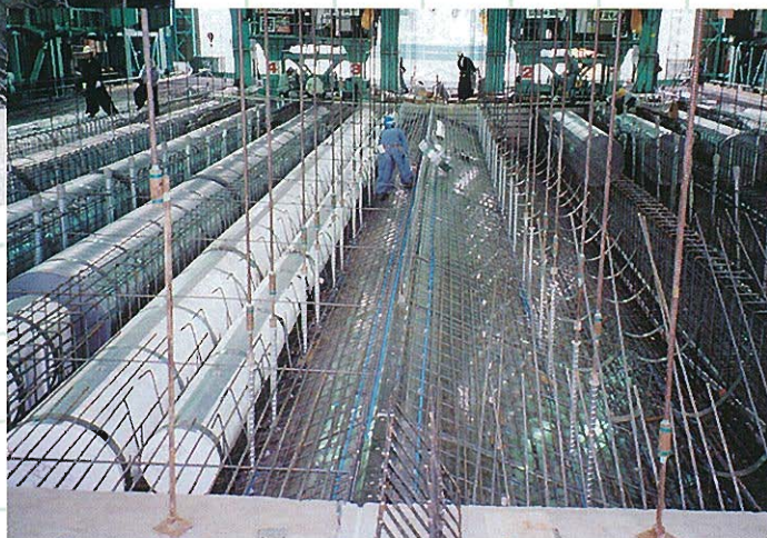
⇩鉄筋組立円筒型枠組立状況