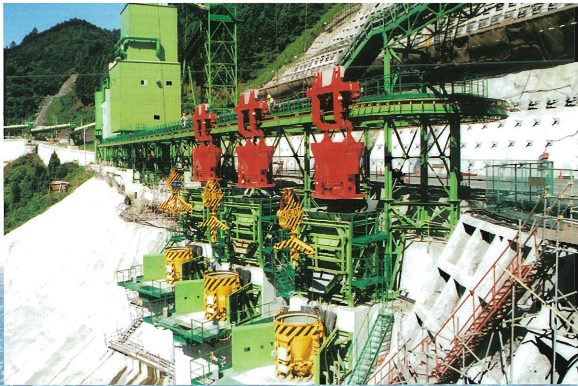
レール走行式⇨ 循環バケット