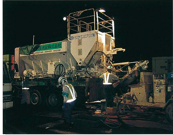
⇩ 施工状況全景 ⇩