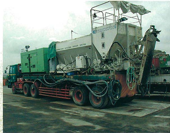
⇩ 施工機械 車載型特殊プラント+ゼネレーター