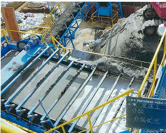
分級状況(脱水コンベアによる脱水)