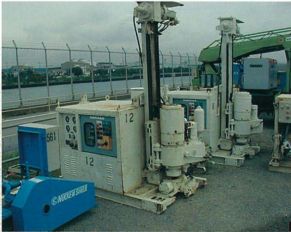
⇩ 施工機械 削孔機械(ボーリングマシン)