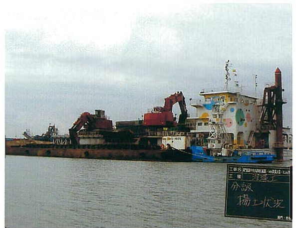
分級施設(分級専用揚土船)