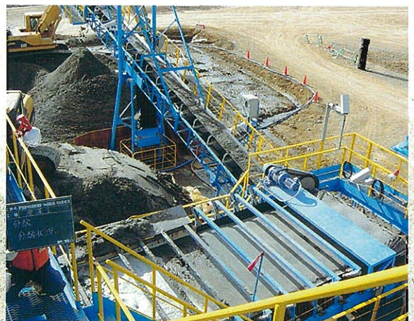
分級過程(脱水→計量)