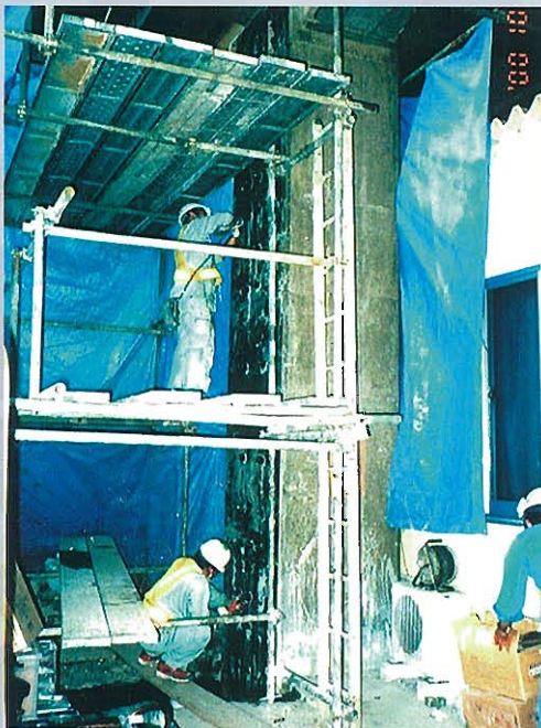
⇧補強鋼板取付け状況