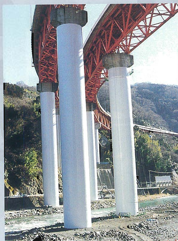
⇩炭素繊維シート巻立て工法による 耐震補強工事完成状況