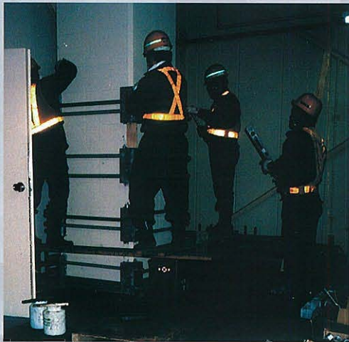
⇧補強鉄筋組み立て状況