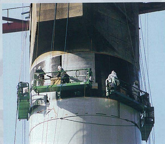
⇩一般ビル用ゴンドラを用いた 炭素繊維シート貼付け状況