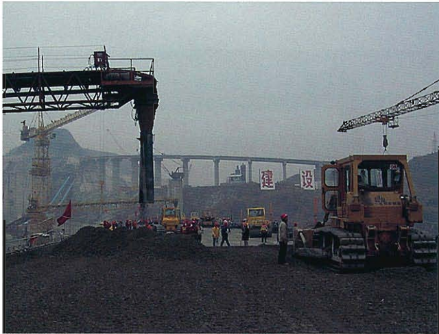
⇩タワーベルコンによるコンクリート打設