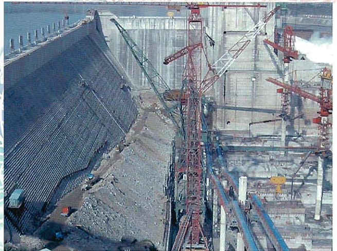
⇩仮締切ダムの下流側面