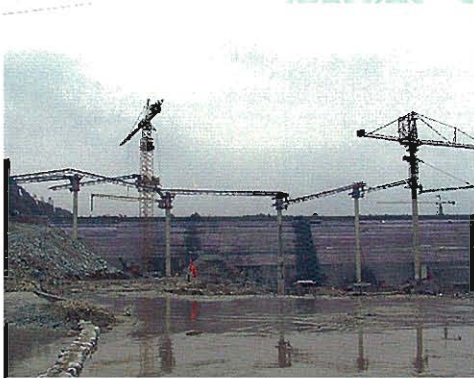
⇨コンクリート打設用 タワーベルコン全景