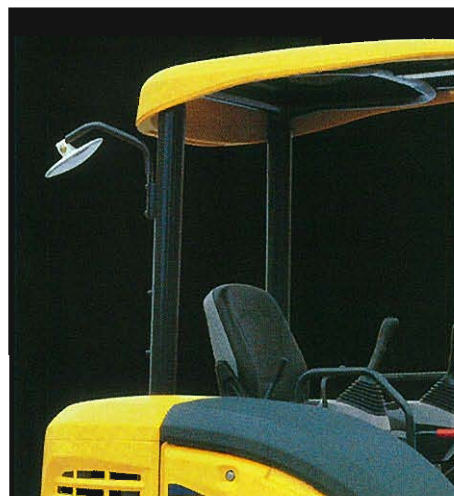
⇩リヤビューミラー 後方超旋回ショベル