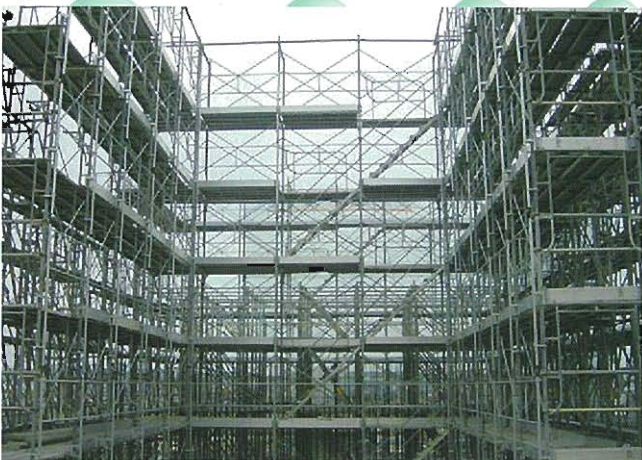
⇨手すり先行足場完成状況(内側)