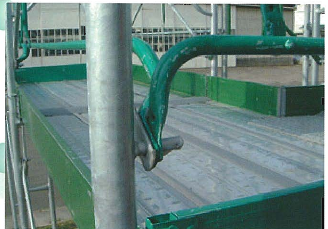
⇨幅木(つま先板)の例