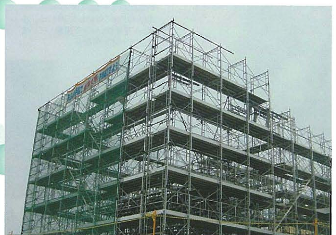
⇨手すり先行足場完成状況(外観)