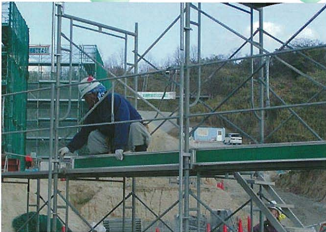
⇨手すり先行足場の仮設状況