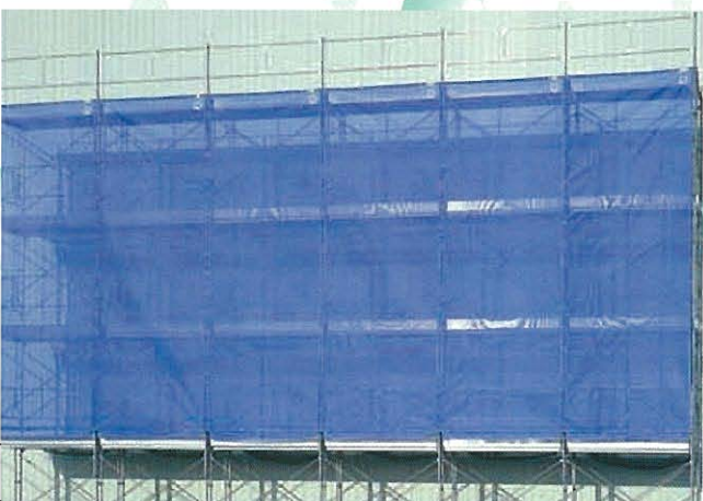
⇨手すり先行足場と養生ネットの併用例