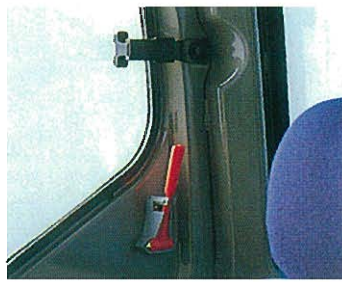
⇩緊急脱出用ハンマー