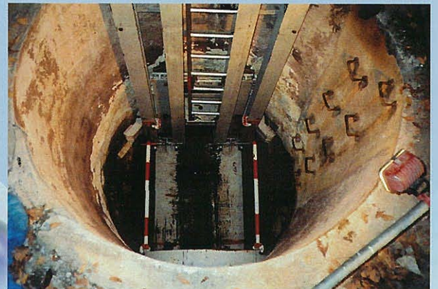
⇐反力装置・昇降用ガイドレール設置完了状況 ⇐先行装置設置状況