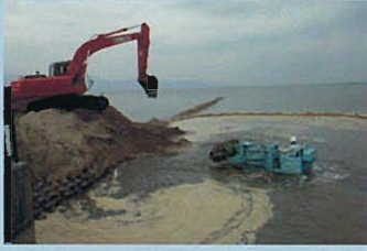
↑重機による堆砂除去作業