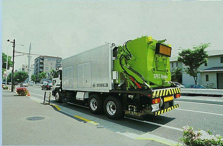
⇐SPEC-Keeper (高速型排水性舗装機能回復・維持機) 作業状況