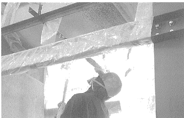
写真-2 振動下での吹付け試験 (たわみ全振幅0.5 mm, 振動数5 Hz, 24時間加振)

このうち、写真-2に示す振動下で吹付けで行った試験体の付着強度試験は、供用中の橋梁に対して吹付け施工が可能であるかどうか評価するもので、施工中および施工後のはく離やひび割れの発生の有無、硬化後の既設部材との付着強度を確認するものです。