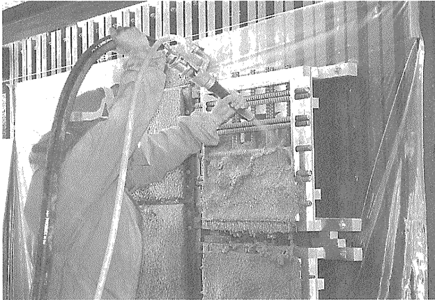
写真-1 鉄筋背面への充填性試験

断面修復材料で要求される付着強度やひび割れ抵抗性、鉄筋背面への充填性については、性能評価方法として現行の試験方法で準用できるものではありません。したがって、これらについては海外の基準等も参考にして新しい試験方法について研究しています(写真-1, 写真-2)。