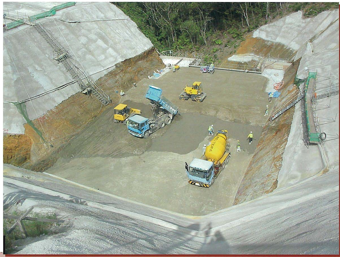
⇩CSG撤出し締固め状況(上下流分割)