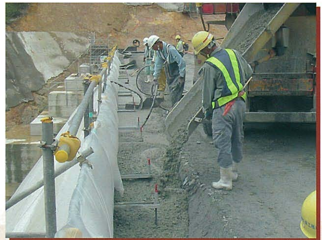
⇩ 保護・遮水コンクリート打設