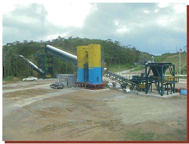
⇩重力を利用したCSG製造設備