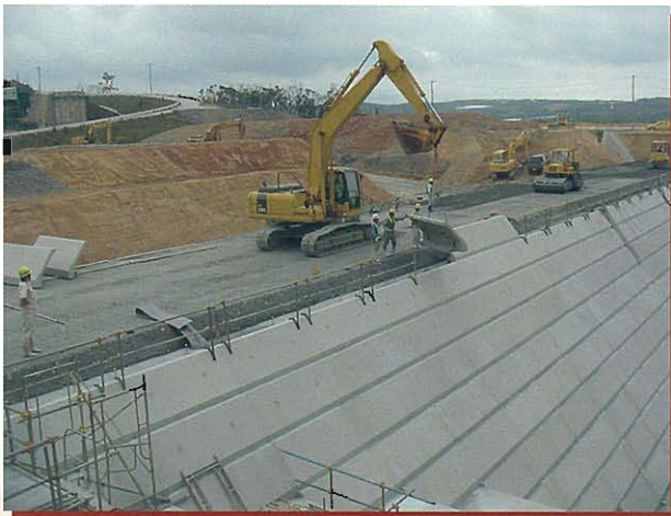
⇩ プレキャスト型枠設置状況