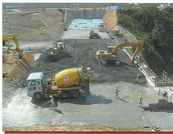
⇩CSG撤出し締固め状況(左右岸分割)