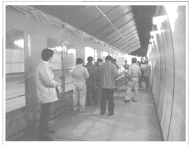
写真一4 実物モデルによる現地体験

また、ワークショップの中で、実物大実験を得意とする当研究所からの提案として、改善対策案としてアンケート調査結果において要望意見の多かった歩道部を覆う案を模擬した仮設の実物モデルを実際のトンネル内に約20m設置し、高校生やワークショップメンバーの方々に通行人に感じる感覚を実際に体験してもらうことを企画し、具体的な仕様について意見収集を行いました（写真一4）。