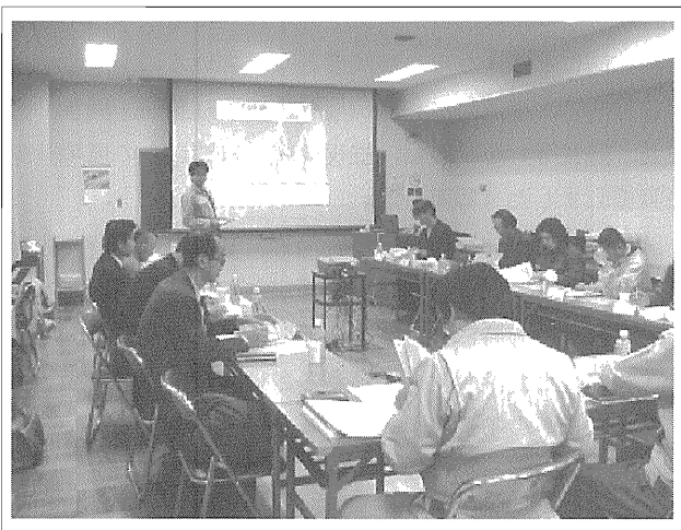
写真一3 ワークショップ開催状況

具体的な対策工の詳細な検討に際しては、アンケートに回答いただいた高校関係者（先生および父母）、地元自治会代表者といった利用者の方々と、防犯・防災面で御協力いただく必要のある警察および消防関係者の方々をメンバー