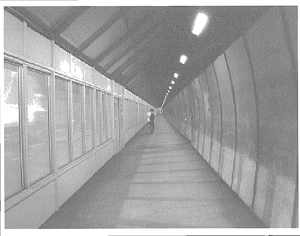
写真-5 対策工完成後のトンネル内歩道部

う非常に特殊な状況下において、これまで表だって問題視されていなかったトンネル内歩道部環境に着目して検討実施されたという点で珍しい検討ケースと思われます。ただし、当該トンネル以外にも同じ目的で歩道部と分離する壁を計画、設置あるいは施工中のトンネルが数例出てきており、今後も利用者の意見を反映させた取組みが広がる可能性は高いものと考えられます。