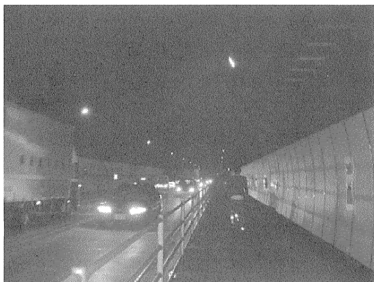
写真一 対策前のトンネル内歩道部状況

今回紹介する国道1号静清 せいしん バイパス しずはたやま 賤機山トンネル（写真一）についても、日交通量約43,000台（大型車混入率：日平均30～40%）を示す幹線道路であるとともに、周囲に高校が6校あることから、主に通学等を目的とした歩道