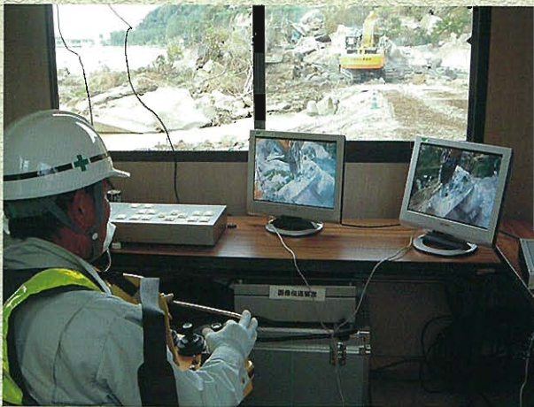
⇄屋内からの遠隔操作