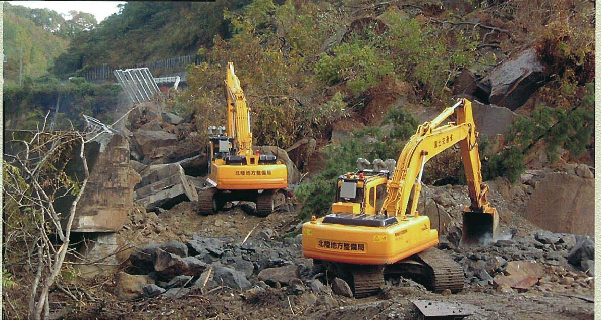
(写真3点及び図面:国土交通省北陸技術事務所提供)