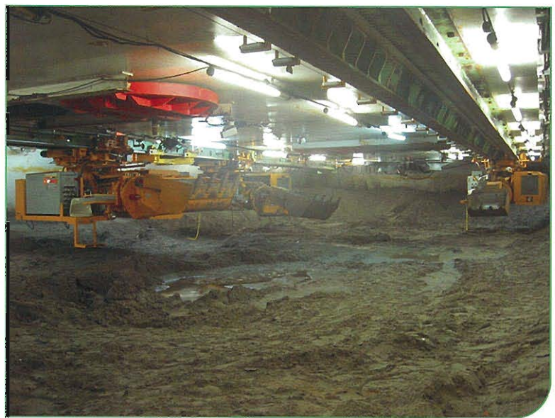
↑函内状況 遠隔操作掘削(天井走行式掘削機3機)