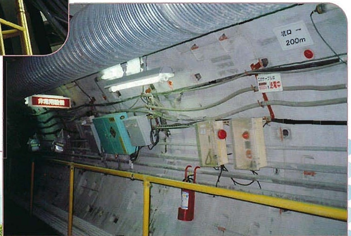
⇨坑内のガス検知警報装置