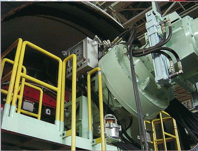
↓防爆スクリュ踊場上シールド操作部