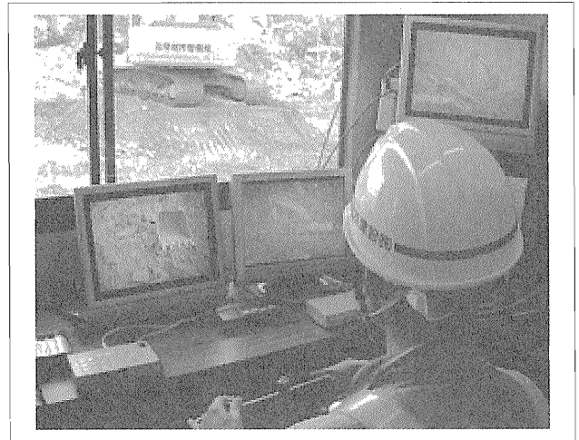
写真-4 妙見町崩落現場復旧工事における遠隔操作

次に、無人化施工機械が使われたのは、長岡市妙見町の土砂崩落現場などである（写真-4）。