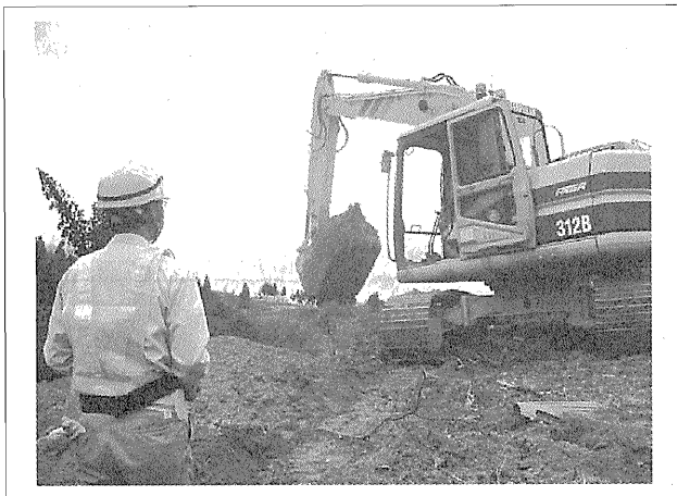
写真-3 山古志村東竹沢地区の無人化施工（平成 16 年 11 月）

地滑り崩落によって道路が寸断されたため、初期の機械搬入は空輸されることになった。このとき、現地での機械組立ては路上で実施するために、吊り降ろし作業への影響を考慮し、近傍の電柱撤去が行われた。