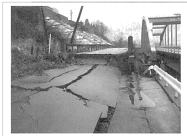
写真-1 道路や橋の被災状況

道路は、主として盛土の崩壊に代表される被災が多かった。その結果、橋の橋台部やカルバート部で50cmを超える段差を生じたり、路面にひび割れを生じ、災害復旧に向けた交通確保のための大きな障害となったようである。段差部は盛土や再舗装によって段差の解消が図られていて、高速道路は幾分波打っていた(写真-1)。