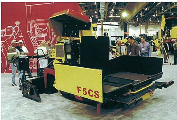
↑DYNAPAC社 小型アスファルトフィニッシャ