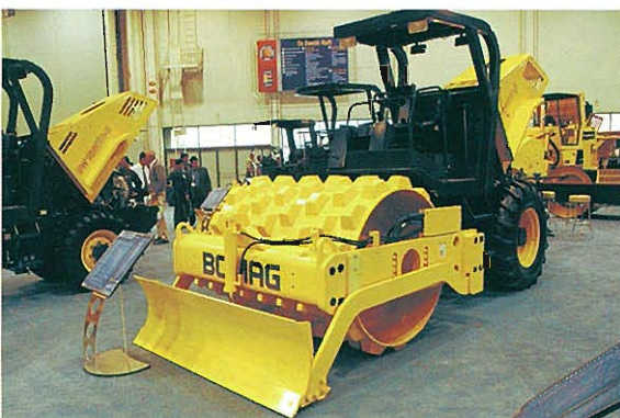
◆BOMAG タンピングローラ