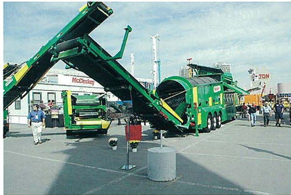
⇨McCLOSKEY INTERNATIONAL社 回転ふるい(トロンメル)