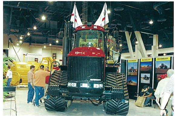
↑REYNOLDS INTERNATIONAL社 超大型ゴム履带式スクレーパ用トラクタ