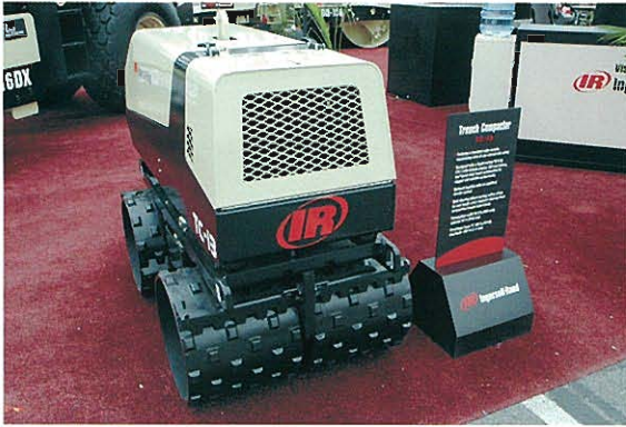
↑INGERSOLL RAND社 トレンチ・コンパクタ