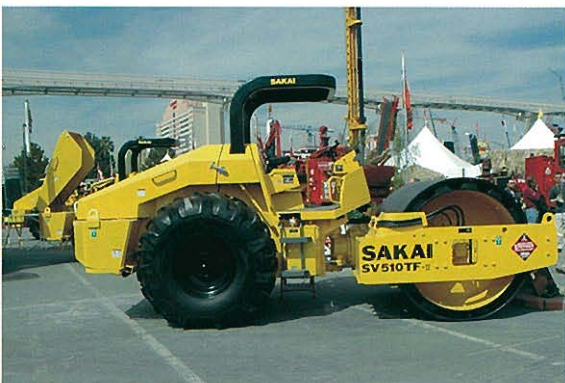
◆酒井重工業 タンピングローラ、スムースローラ兼用土工ローラ