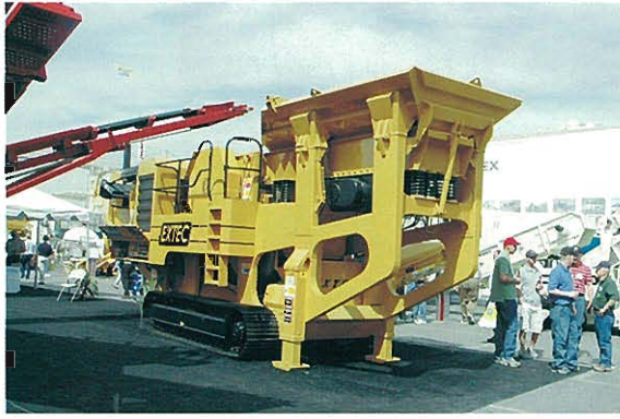
⇨EXTEC SCREENS&CRUSHERS社 クローラ式移動クラッシャ