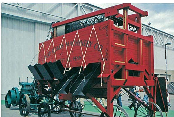
⇨ 草創期の回転ふるい