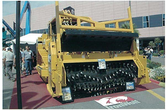
⇨IRONWOLF社 クラッシャと呼ばれる路面切削機