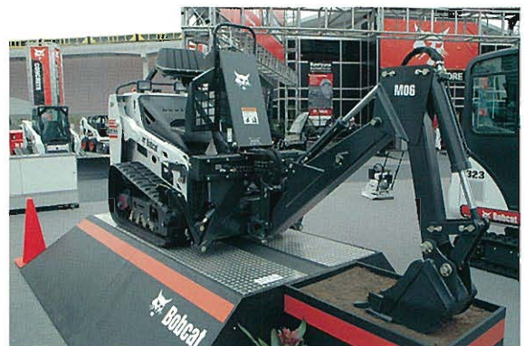
↑BOBCAT社 ゴム履带式小型油圧ショベル