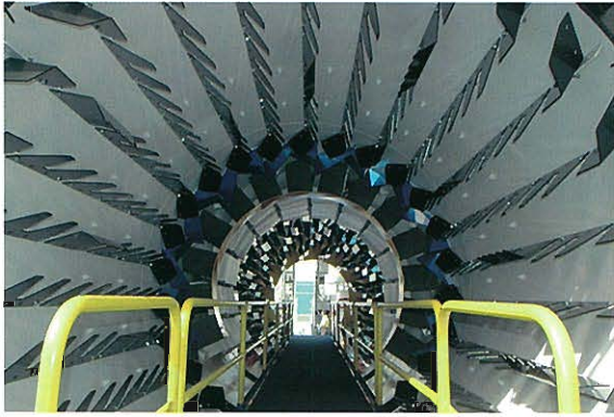
⇨ アスファルトプラント用乾燥機械の内部