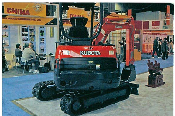
◆クボタ 小型油圧ショベル