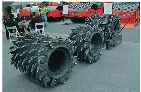
↑WIRTGEN社 路面切削機用切削ビットドラム