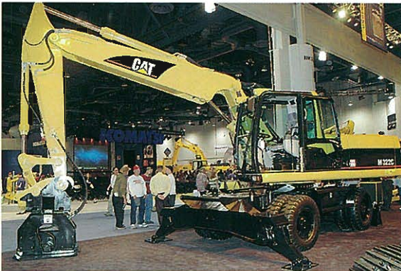
◆キャタピラー ホイルタイプ油圧ショベル+特殊アタッチメント