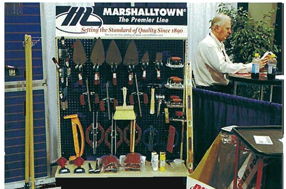
⇨ MARSHALLTOWN COMPANY社 コンクリート・土工用工具