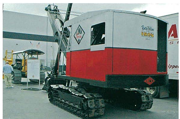
⇨ 1946年製の草創期のショベル