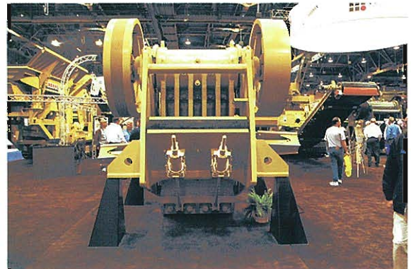
⇨ASTECH INDUSTRIES社 ジョウクラッシャー