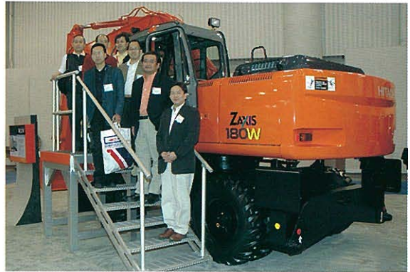
◆日立建機 ホイルタイプ油圧ショベル