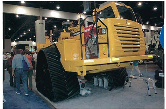
⇨MISKIN SCRAPER WORKS社 ゴム履帯式スクレーバ