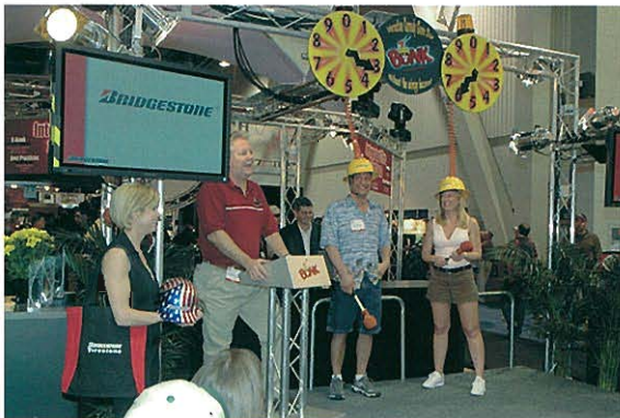
⇨ 入場者参加のアトラクション