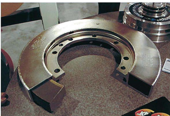
↑COMMINS社 シリコンオイル入りエンジン回転バランサーのカットモデル