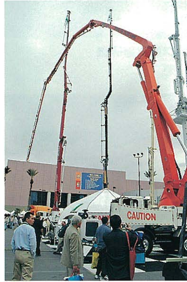
⇨SCHWING AMERICA社 約55mのboomを持つ大型コンクリートポンプ