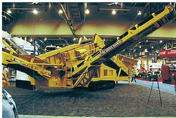
⇨THE SCREEN MACHINE クラッシュプラント用選別機