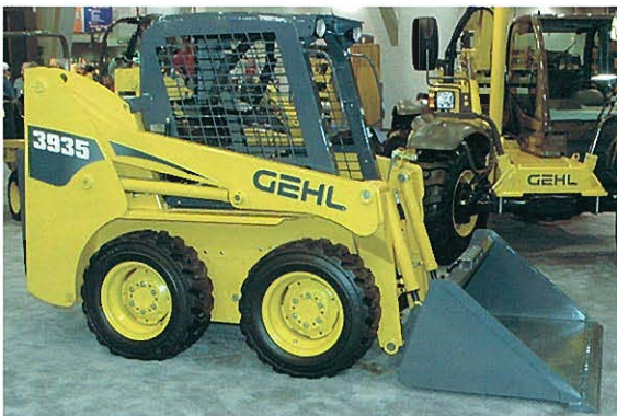
↑GEHL COMPANY社 コンパクトホイールローダ