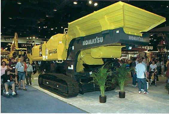
◆コマツ ガラバゴス廃材破砕機