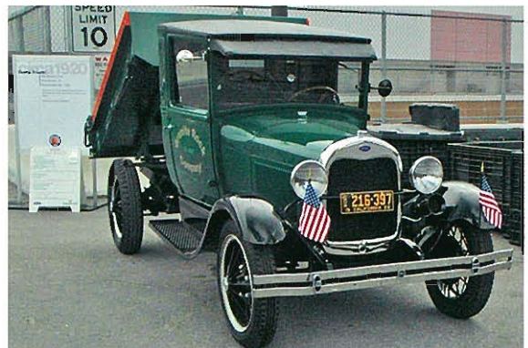
⇨ 1920年代のダンプトラック