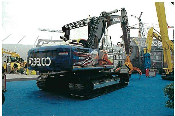
◆コベルコ建機 アメリカンイーグルの絵の入った油圧ショベル