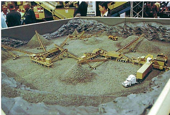
⇨ クラッシュプラントレイアウト模型