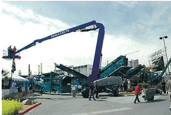
⇨GENIE INDUSTRIES 高所作業車