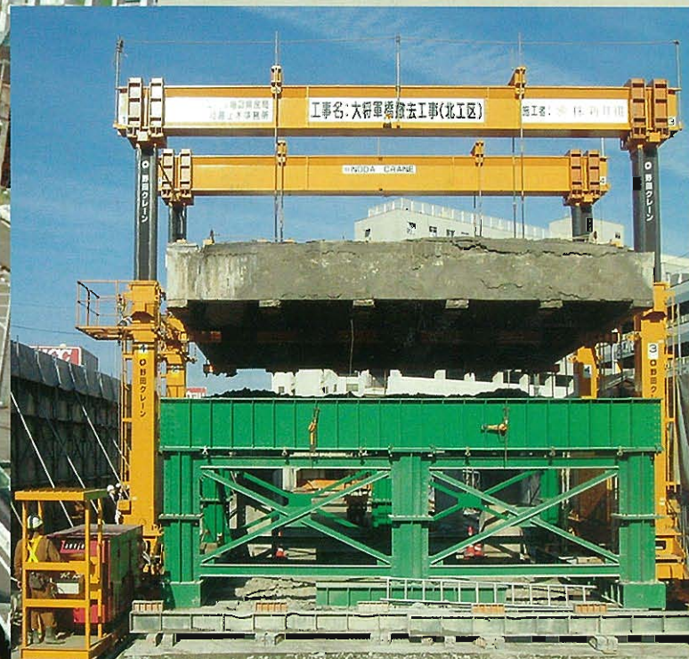
橋梁上部工一括撤去工法