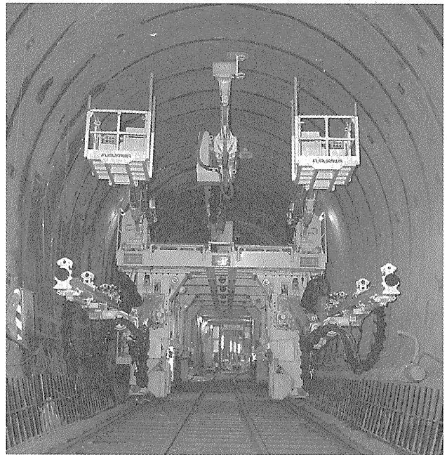
写真—2 油圧削岩機（現在）