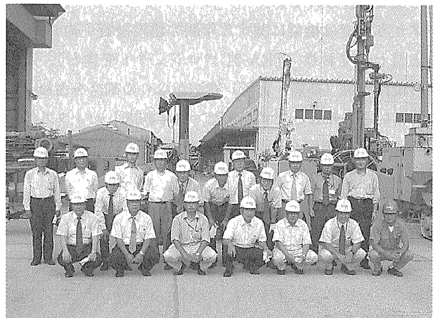
写真—3 吉井工場見学