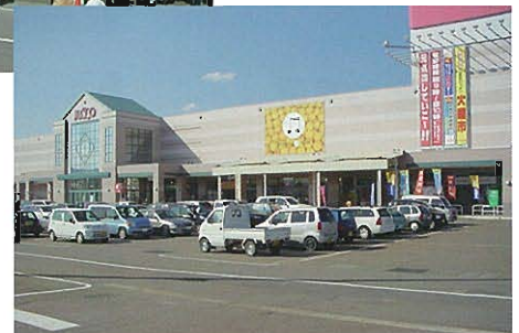
被災から約10カ月ぶりに再開した商業施設(左：川口町、右：小千谷市)