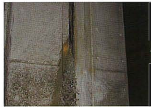
被災状況(水処理施設の漏水,H16.10.25)