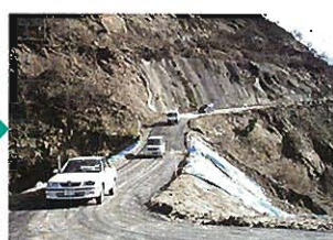
工事用道路を通行(H16.12.5)