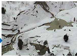
緊急対策を完了させ雪解けを待つ状況(H17.4.7)