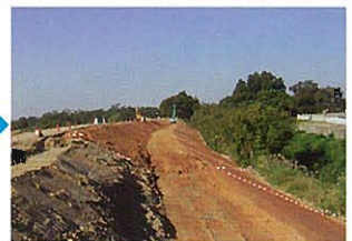
本復旧の施工状況 (H17.10.13)