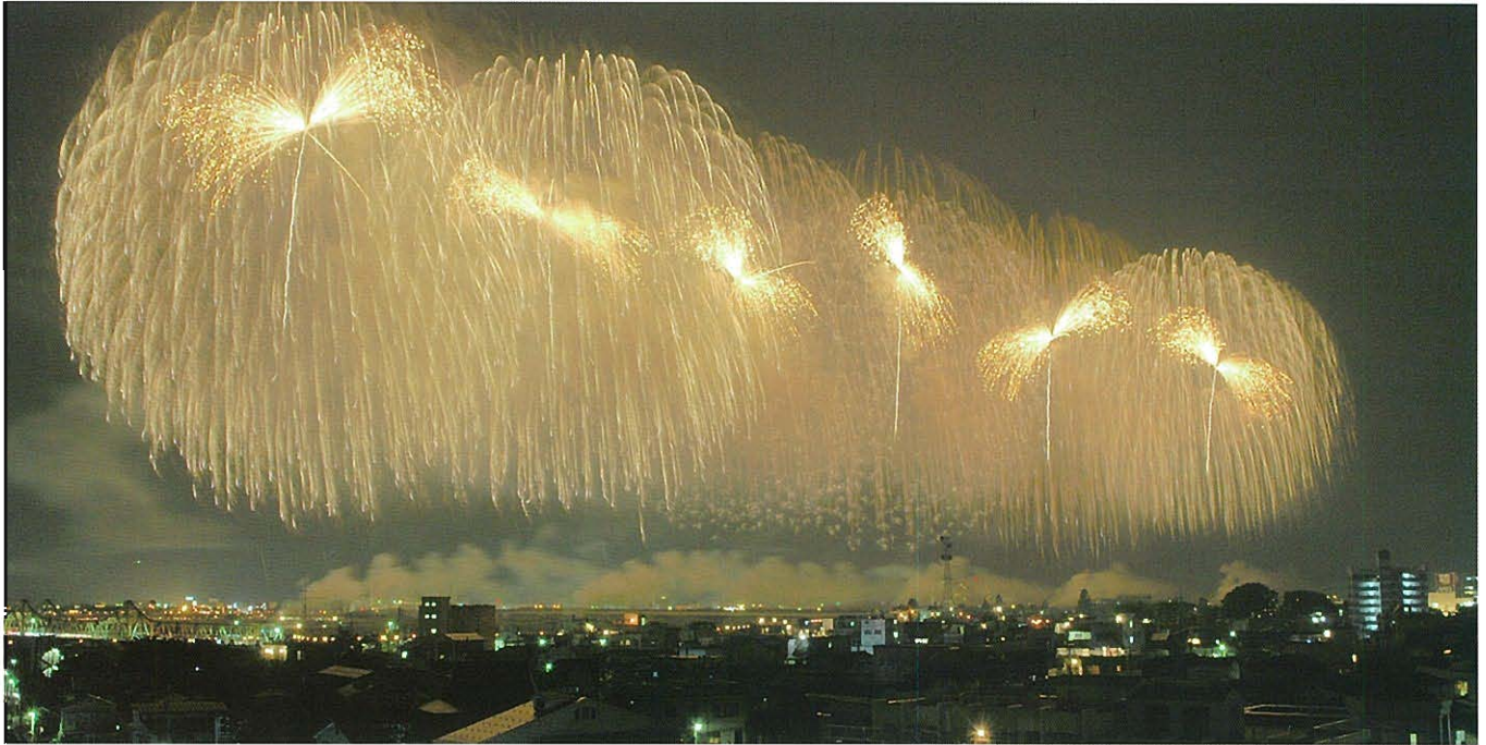
この8月、75万人(2日間)もの観客が訪れた長岡まつり大花火大会の震災復興祈願花火「フェニックス(不死鳥)」

平成16年10月23日に発生した震度7の「新潟県中越地震」は、都市部から中山間地に至る広い範囲に大きな被害をもたらしました。関係機関が全力を挙げて取組み、地震発生から約1年、被災地は復旧・復興へ向け着実に歩み始めています。