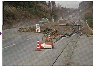
迂回路による片側交互通行(H16.12.3)