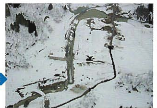
緊急対策を完了させ雪解けを待つ状況(H17.4.7)