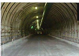
付け替えトンネル内部(H17.9.29)