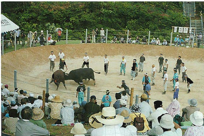
5月に仮設闘牛場で復活した旧山古志村の「牛の角突き」(長岡市東山ファミリーランド)