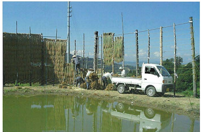
被災から復旧した水田での稲刈り(ハサガケ)の様子(小千谷市小栗山)