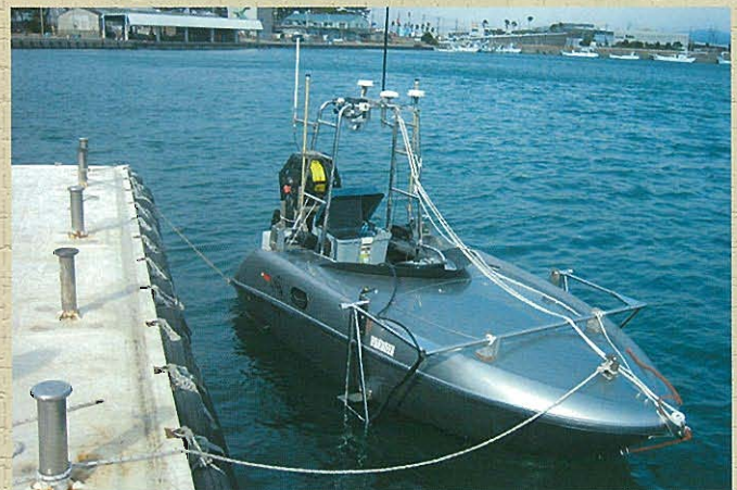
⇩自動測量船UMV 着水状況