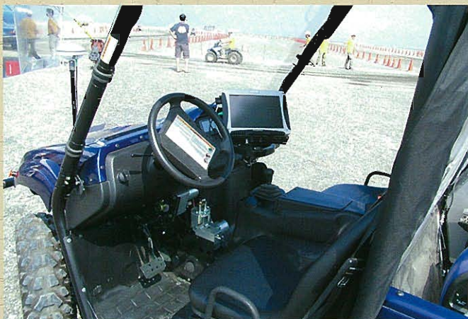
⇩自動測量車UGV 操縦席(PC搭載)