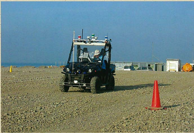
⇩自動測量車UGV 測量状況