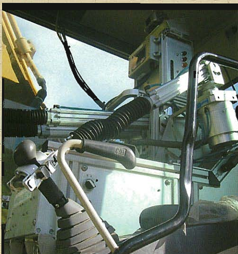
↑バックホウ用ロボQ