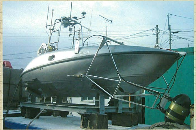
⇩自動測量船UMV 外観(ナローマルチビーム搭載)