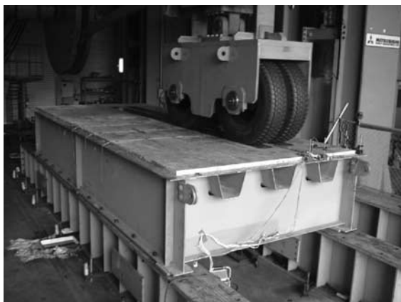
写真一2 移動載荷疲労試験 (首都高速道路株式会社、 中日本高速道路株式会社より受託)