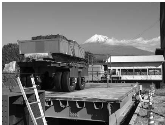
写真一3 移動載荷疲労試験 (国土交通省より受託)