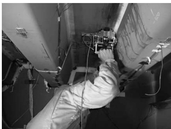
写真一5 タイヤ式鋼床版探傷装置 (財)首都高速道路技術センターと共同開発)

労試験機は、屋外に設置したものであり、自然の風雨や日照を繰り返し受けながらの自然環境下で試験が可能となっている。それぞれの移動載荷疲労試験機を使って鋼床版の疲労試験を行っている状況を写真一2、3に示す。