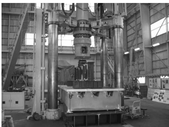
写真一4 大型疲労試験 (首都高速道路株式会社より受託)