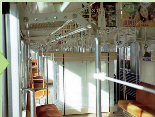
↑ 5 : 運搬