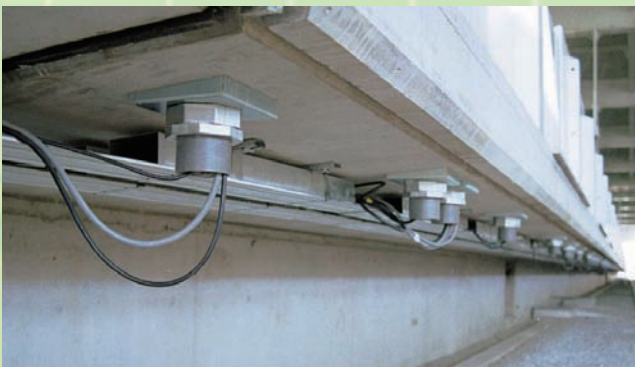
↑基礎および配線口