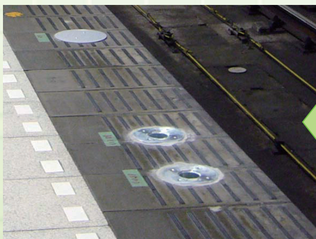
↑ 3 : 基礎埋設