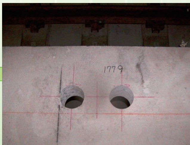
↑ 2 : コア削孔