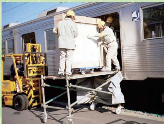
↑ 4 : 積み込み