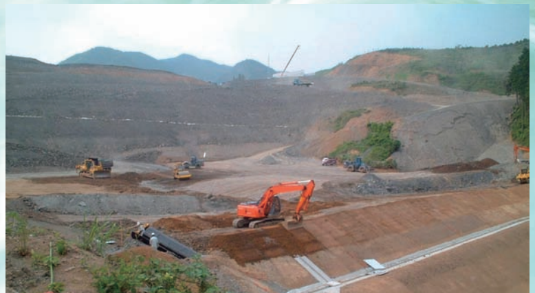
⇨ 6：90 m 級の高盛土施工箇所における盛土のり面仕上げ（盛土中段付近）