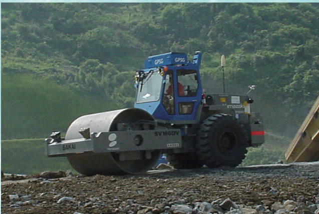
⇨ 3：GPS を搭載した 320 kN 級振動ローラによる盛土の転圧