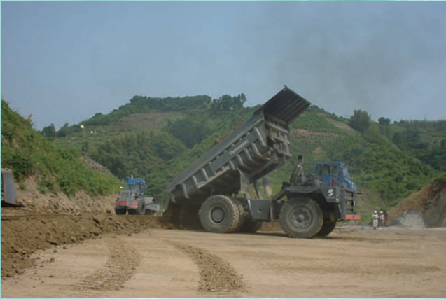
⇨ 1：46 t 積級の重ダンプによる掘削土砂の運搬，積み下ろし