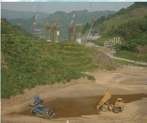
⇨ 5：60 m 級の高盛土施工箇所における大型機械による盛土（盛土初期段階）