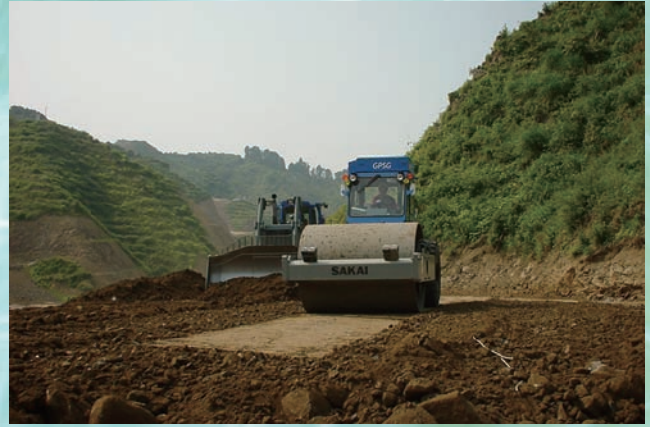
⇨ 2：320 kN 級振動ローラによる転圧作業と，32 t 級ブルドーザによる盛土材料のまき出し