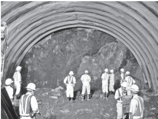
写真—1 大原トンネル

平成20年度は、大原トンネル（延長430m）、あさはたトンネル（延長840m）で施工技術支援を実施しており、両トンネルの支保構造の変更、補助工法の採用、掘削方式の変更等の施工方法に関する検討を行った。また、委員会に当研究所職員が出席し、施工計画および施工方法の検討を行った。その結果、両トンネルとも平成20年度内に無事貫通した（写真—1）。