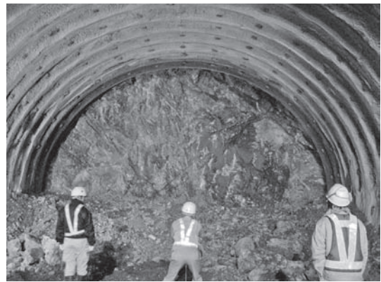
写真—2 南島BP1号トンネル

山梨県では、管内のトンネル工事に対し、各トンネルの調査・設計資料から技術的な課題を整理するとともに、工事に対する技術的な支援（助言、検討等）を