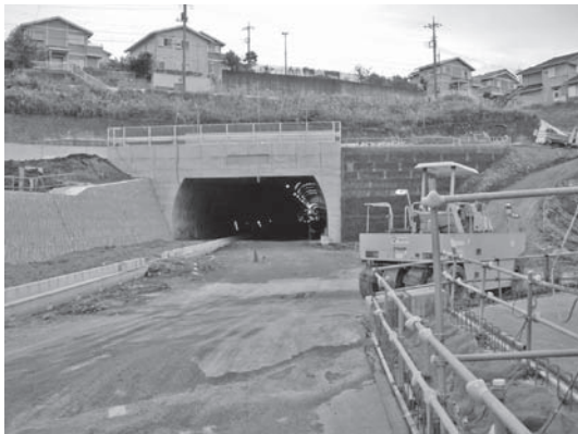
写真—4 かわせみトンネル

平成 20 年度は、施工技術支援を現場にて実施し、当該トンネルが有する技術的課題（地表面の住宅等に対する沈下抑制、起点側坑口部の拡幅断面の施工）に対し、対策工の選定や施工方法等について、工事が安全かつ経済的に行われるように助言を行った（写真—4）。