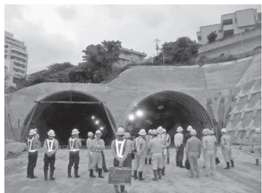
写真—3 識名トンネル

平成20年度は、平成18、19年度に引き続き、「識名トンネル（仮称）施工技術検討委員会」を運営し、超近接トンネルの施工法について検討・審議するための資料作成を行った。資料作成にあたっては、現地にて確認した施工状況と計測データを基に地上に家屋が密集する終点側坑口側の支保工仕様見直し等の技術的課題を発注者および施工業者と現場状況に応じた検討を行い、委員会に提案した（写真—3）。