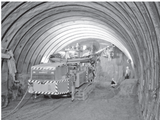
写真—5 新武岡トンネル

平成 20 年度は、今後のトンネル施工計画に対する精査とトンネル有識者を交えた施工 WG の資料作成等を通じて、施工計画の検証を行った。施工 WG では、急傾斜地指定斜面や小土被り部の施工および終点側二次シラス部における対策工等の諸課題に対する技術的な判断や妥当性の検証を行った（写真—5）。