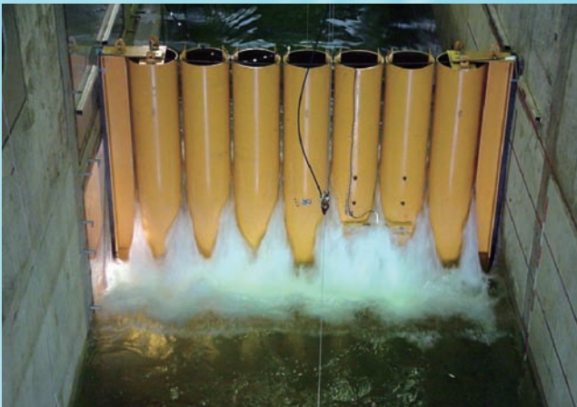
⇨水理模型実験（津波対象波・港内側より）