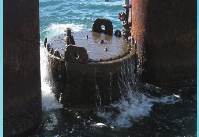
⇨実海域実証試験（上部鋼管浮上状況）