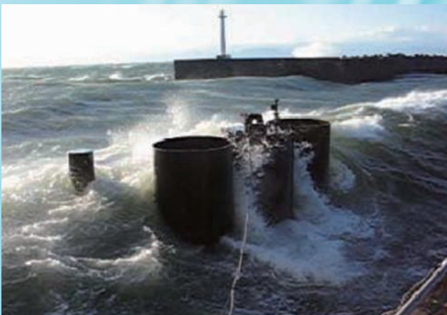
⇨実海域実証試験（波浪時の状況）