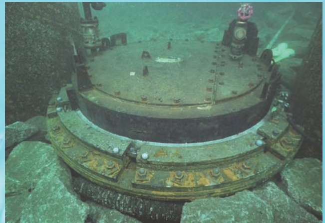
⇨実海域実証試験（海底格納状況）