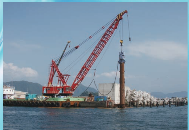
⇨実海域実証試験（下部鋼管打設状況）