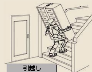
引越し (屋内作業アシスト)