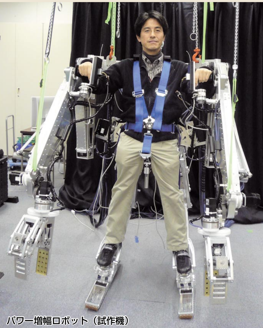
パワー増幅ロボット (試作機)