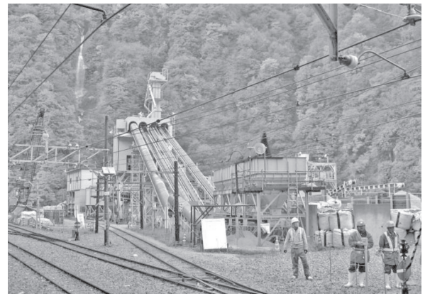
写真—2 坑外仮設備設置状況

トンネル工事用列車は黒部峡谷鉄道の側線を利用して運行するが、黒部峡谷鉄道沿線は日本有数の観光地でもあるため（写真—3）、観光シーズンになると多くの観光客が訪れることから運行ダイヤへの影響や観光客の方々並びに第三者への配慮が必要であり、工事に対する理解を図るべく慎重且つ安全な施工が要求される。また、冬期には積雪に伴い工事が一時中断される