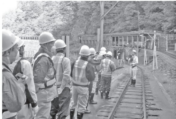
写真-1 現場見学会状況

位置する鷲羽岳(2,924m)に源を発し、立山連峰と後立山連峰の間を北上して富山湾に至る幹川流路約85kmのうち約80%をV字形の谷が占め、平均河床勾配1/5~1/80という日本有数の急流河川であることから、河川を流れる土砂も非常に多い。