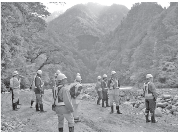
写真-5 河床道路設置状況視察

この見学会を終えた約2週間後には現場は越冬対策を並行して進め、切羽の最も安定した状態にて掘削を一時中断し、坑外設備の一部解体、養生後に越冬期間に入る。