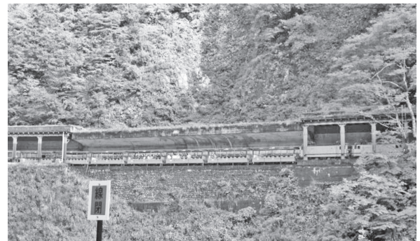
写真—3 黒部峡谷鉄道運行状況

ことにより、11月末頃より現場は越冬対策に入り、翌年の4月下旬頃に状況判断した上で工事が再開されるという。