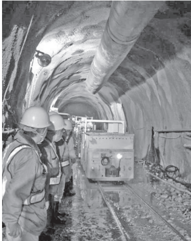
写真-4 掘削ズリ搬出状況視察

工事は既設の機搬坑道より分岐した横坑の掘削が完了し、現在本坑を約90m掘削したところである。トンネルの掘削はNATM発破レール工法により、全ての掘削機械はバッテリー機関車にて牽引され切羽へと向かう。掘削したズリはシャフローダにより鋼車へと積み込み坑外へ搬出される(図-2, 写真-4)。