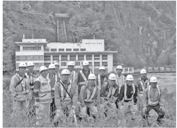
写真-6 見学者集合写真