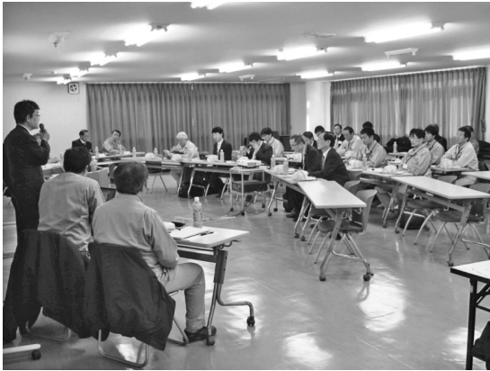
写真—3 構造説明状況