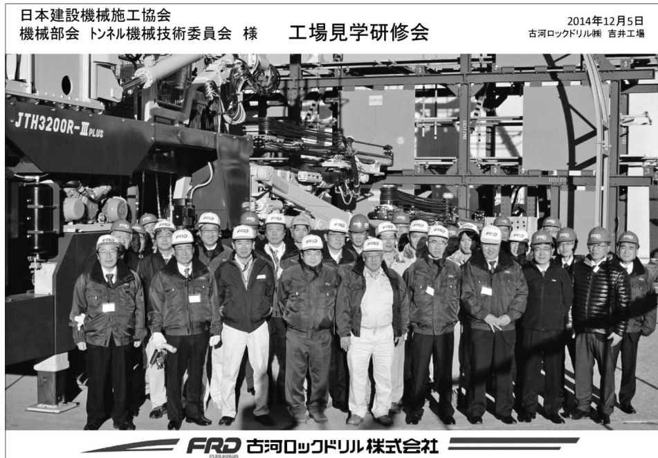
写真—5 工場見学研修会 集合写真

とで作業ステップ毎の操作を間近で見学・説明を受けることができ、その施工管理技術について直接理解することができた。また、オペレータ席にも搭乗することができ普段体験することのできない機械見学研修会であった。見学後の質疑応答も活発な意見交換が続き、あっという間に所定の時間が過ぎてしまった。