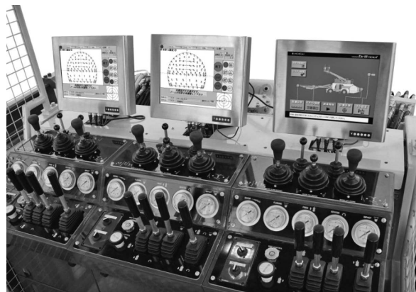
写真—2 操作席(オペレータ席) NAVI画面