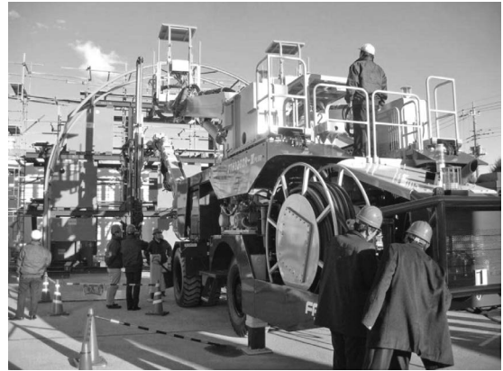
写真—4 実機見学風景