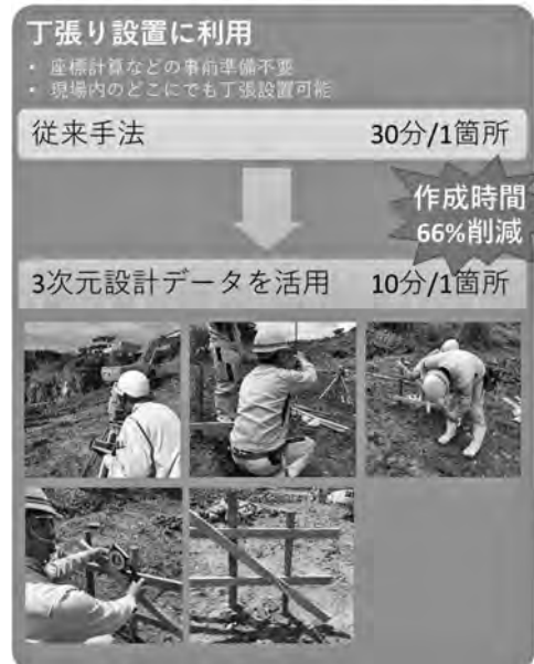
図—6 3次元設計データ活用例（丁張設置）