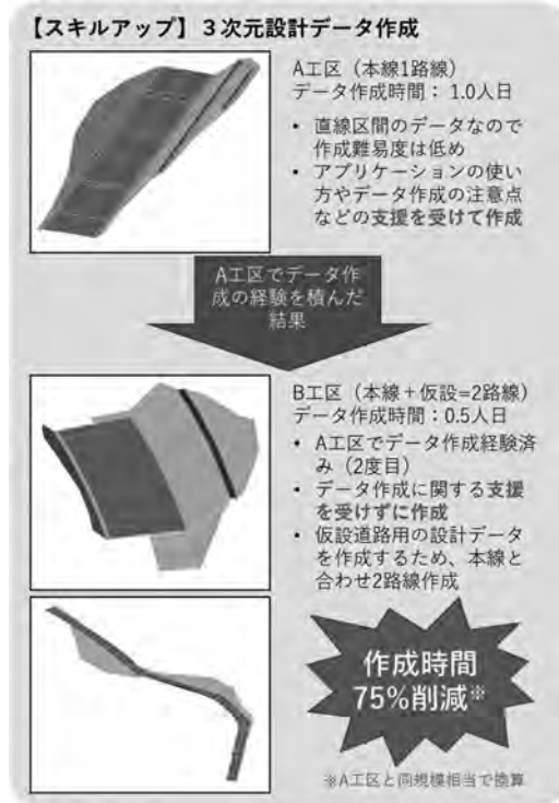
図—5 3次元設計データ作成時間 省力化効果

現場の規模としては A 工区に関しては延長約 100 m、掘削土量約 20,000 m 3 、法面整形約 2,000 m 2 であり、B 工区は本線延長約 100 m、仮設道路約 200 m、掘削土量約 9,000 m 3 、法面整形約 1,000 m 2 であった。A 工区のデータ作成を行う際は、ソフトウェア等の使用方法やデータ作成時の注意点等の支援を受けながら作成を行い、作成時間は 1 人・日であった。この作成経験を踏まえ、B 工区にてデータ作成を行ったところ、データ作成の支援なしで本線+仮設道路の計 2 路線の作成時間は 0.5 人・日であった。A 工区と同規模相当で換算を行うと作成時間は 0.25 人・日であり、75%程度の作成時間が削減された。データ作成に関して難しいというイメージを持ちがちだが、ソフトウェアの操作方法等を理解することで作成時間を削減することが可能となる（図—5 参照）。