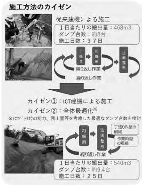
図-3 施工方法改善結果

そこで従来機の代わりにICT建機(MCバックホウ)を導入した。従来であれば丁張設置後、粗掘削、法面整形作業を行っていたが、ICT建機を導入することによって、丁張設置作業がなくなり、粗掘削・法面整形作業の繰り返し作業となった。その結果、日当たり施工量が従来に比べ、およそ1.15倍に増加した。さらにICT建機の能力に合わせたダンプの運行管理を行うことにより、25日間で施工が終了し、従来施工に比べ、12日間の工期短縮が実現した。短縮された理由としては、従来施工であれば多くの丁張設置・スラント確認作業を行う必要があったが、ICT建機を導入することで丁張設置・スラント確認作業が削減された。加えて、施工のムラを無くすことでダンプの待