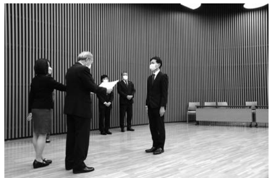
写真—6 表彰式状況①（表彰状授与）