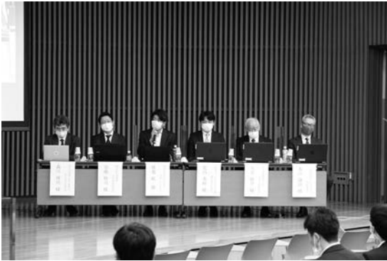
写真—11 パネルディスカッション②（パネリストの皆様）