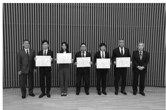
写真—7 表彰式状況②（表彰者記念撮影）