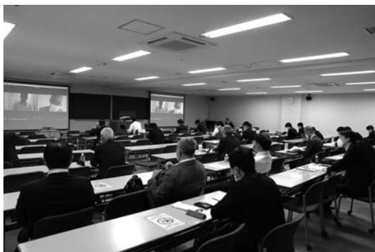
写真—2 論文発表会場の様子①