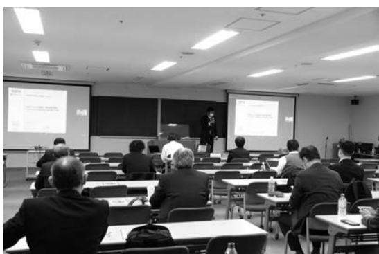
写真—3 論文発表会場の様子②