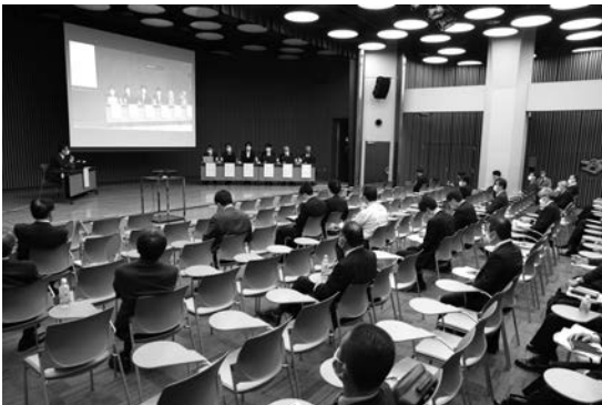
写真—12 パネルディスカッション③（会場風景）