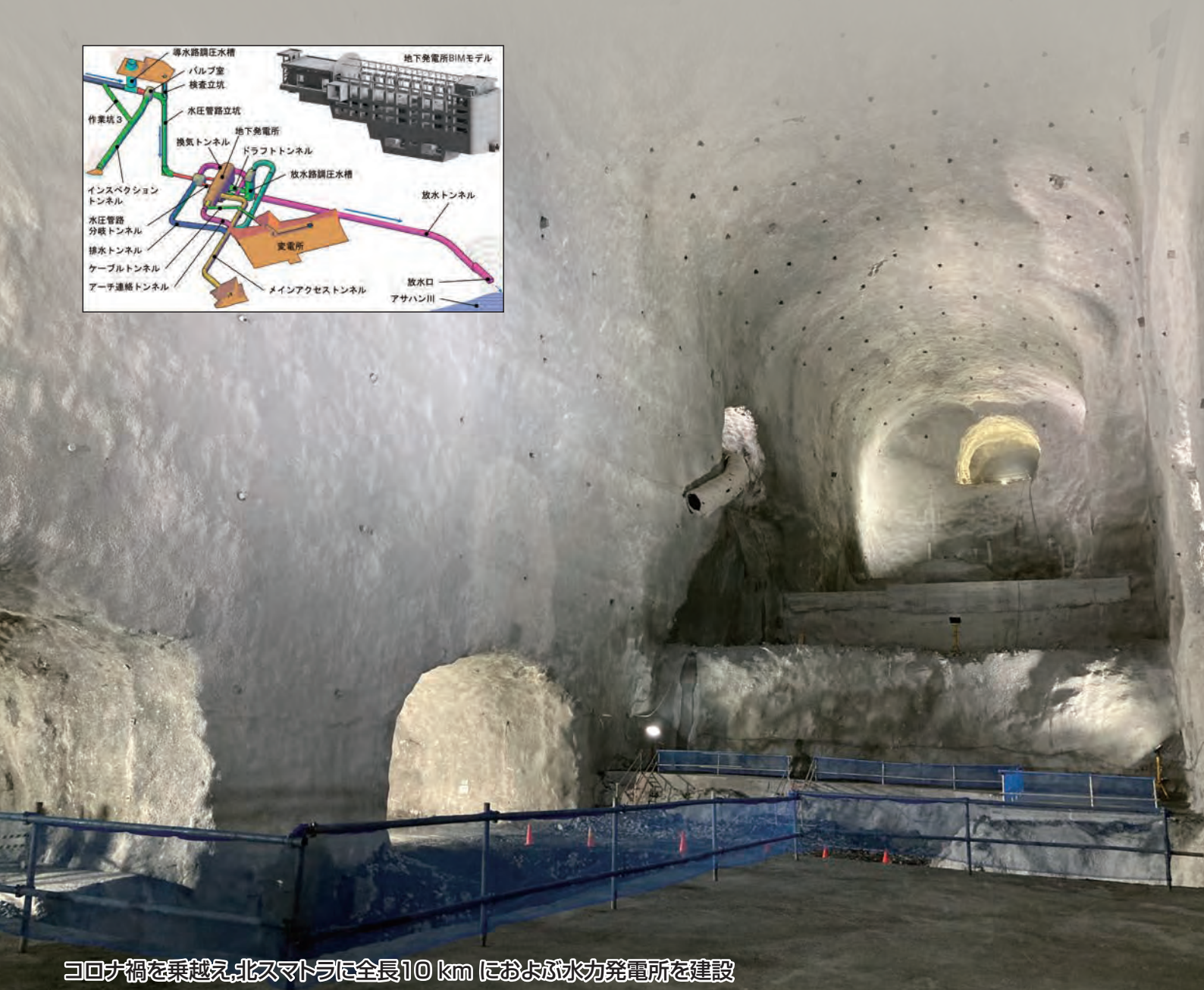
コロナ禍を乗り越え、北スマトラに全長10 km におよぶ水力発電所を建設