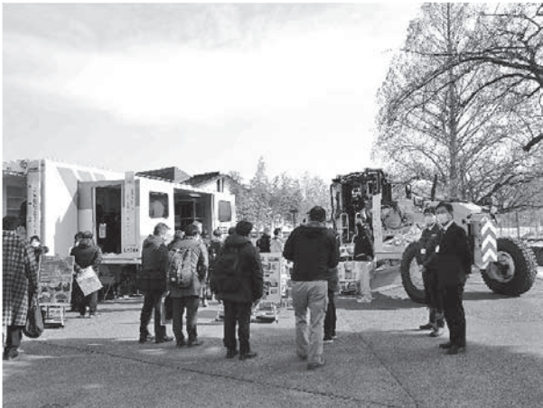
写真一八 東北技術事務所