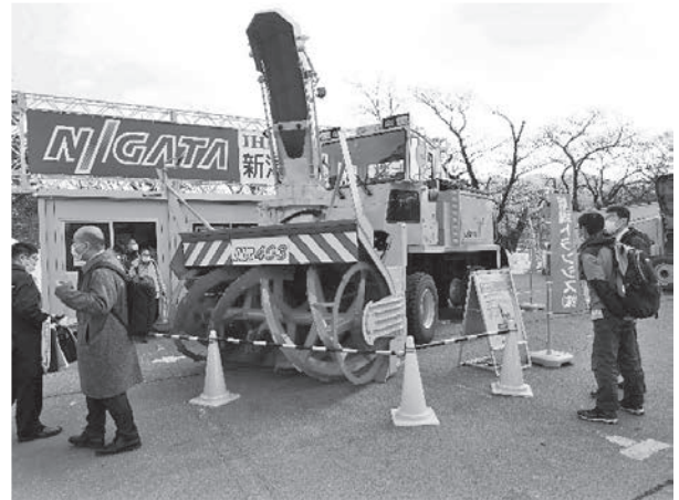
写真-13 新潟トランス(株)