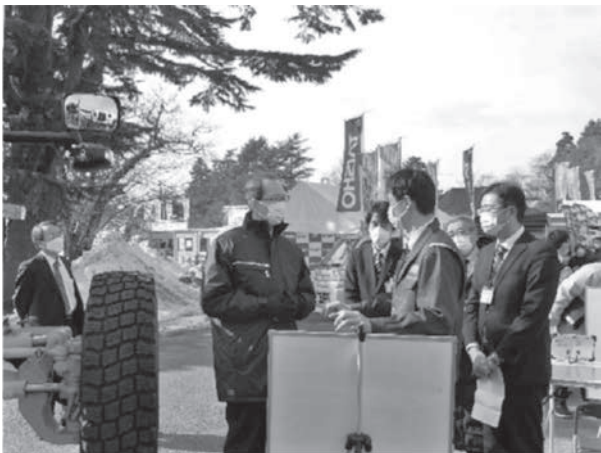
写真一六 東北技術事務所の説明を受ける内堀福島県知事