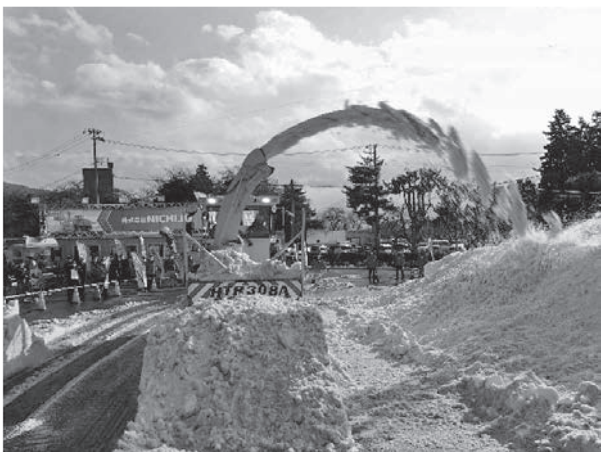
写真二二 (株)NICHIGO ロータリ除雪車 HTR308A