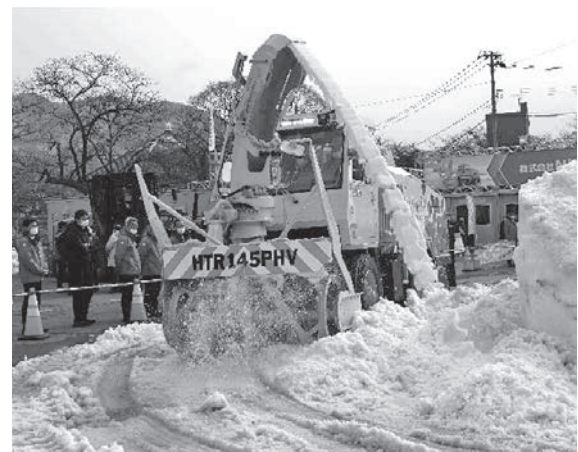
写真二三 (株)NICHIGO プラグインハイブリッドロータリ除雪車 HTR145PHV