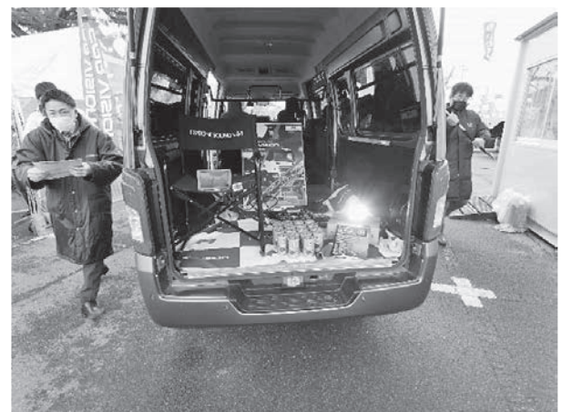
写真-17 メルコモビリティソリューションズ(株)