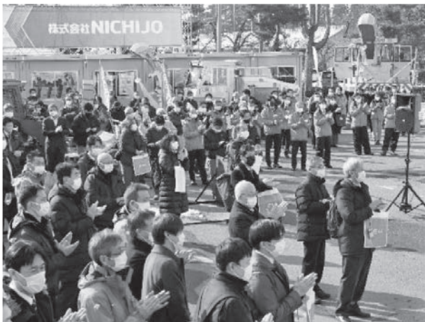
写真一4 オープニングに集まった来場者