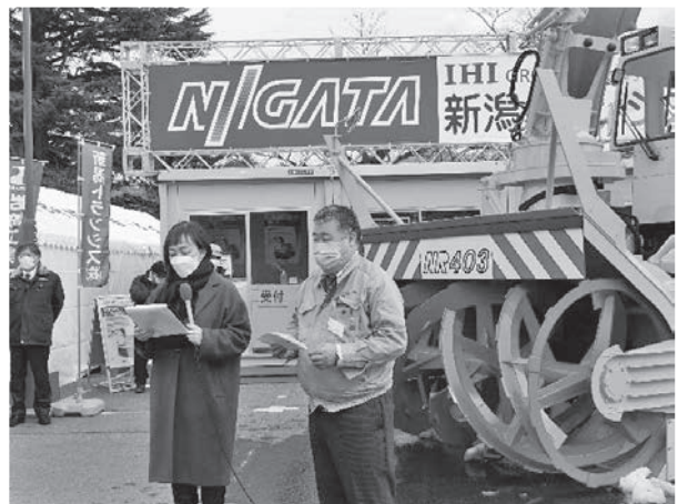
写真一九 新潟トランスィス㈱のインタビュー状況