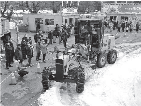
写真二〇 西尾レントオール(株) グレーダ MG230