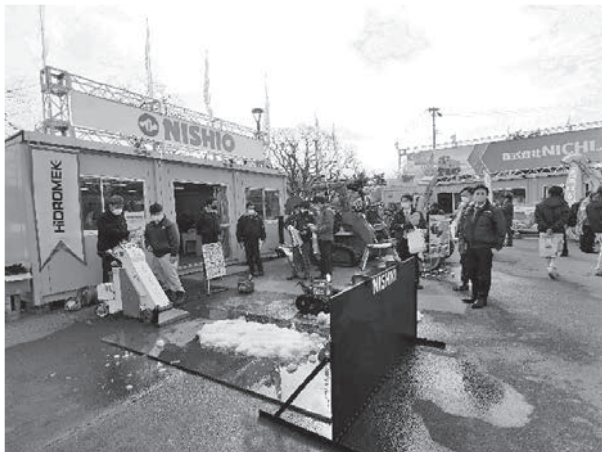
写真-14 西尾レントオール(株)