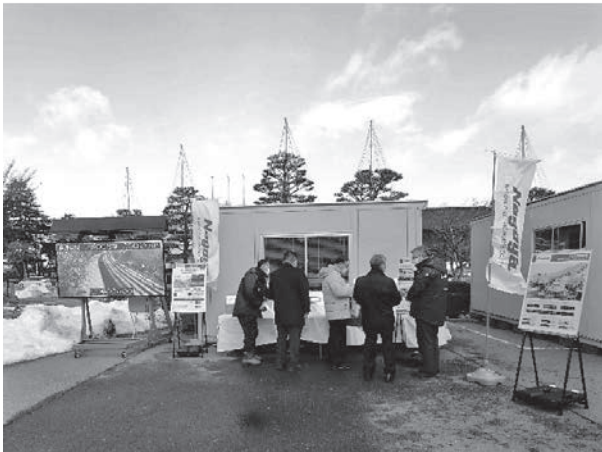
写真-12 名古屋電機工業(株)