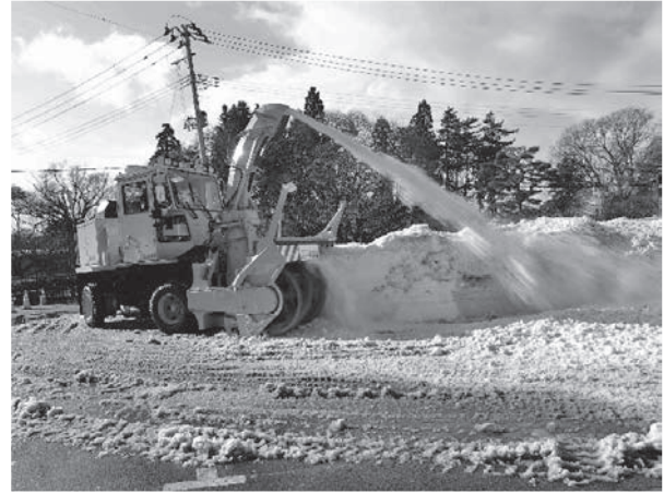
写真一 24, 25 新潟トランス(株) ロータリ除雪車 NR403