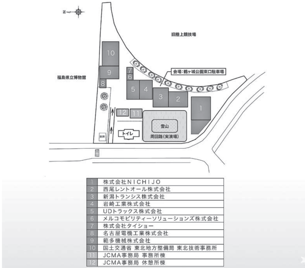
図-1 ブース配置図と出展会社名