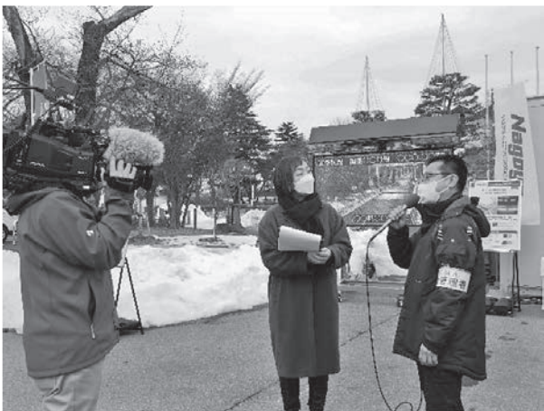
写真一八 名古屋電機工業㈱のインタビュー状況