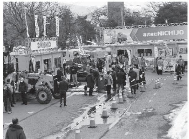
写真一5 出展者ブースを見学する来場者