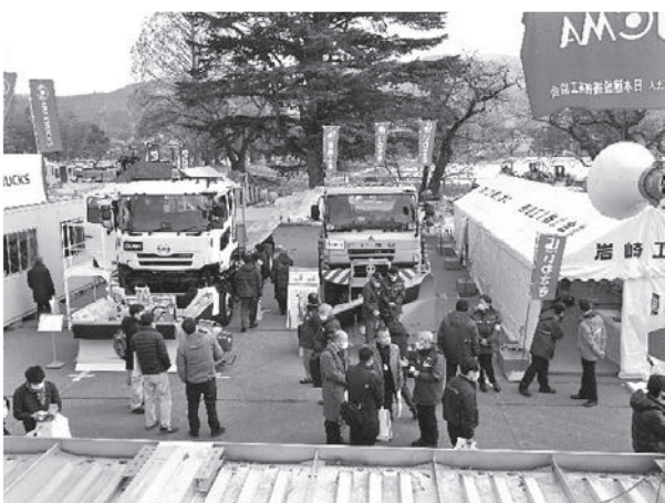
写真一〇 岩崎工業㈱・UDトラックス㈱