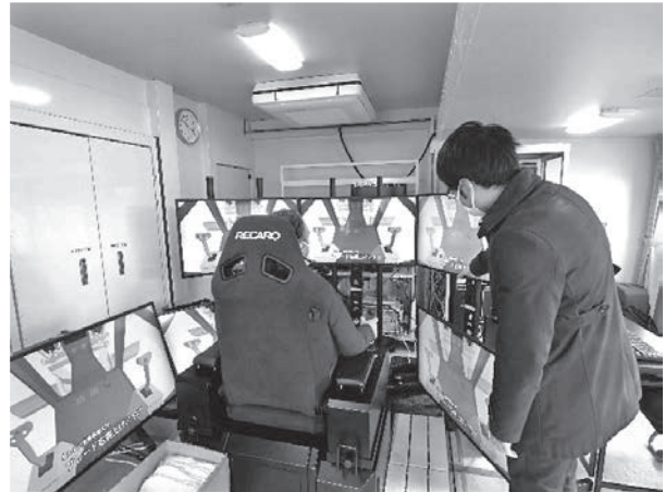
写真一九 東北技術事務所 本部車内