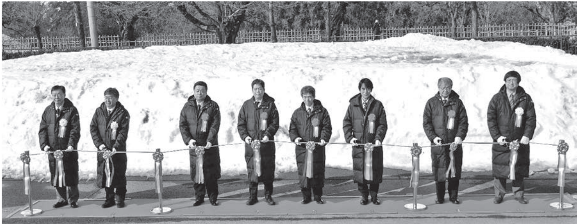
写真一3 来賓，関係者によるテープカット