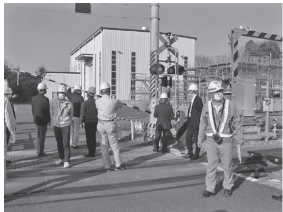
写真—7 踏切と遮断機