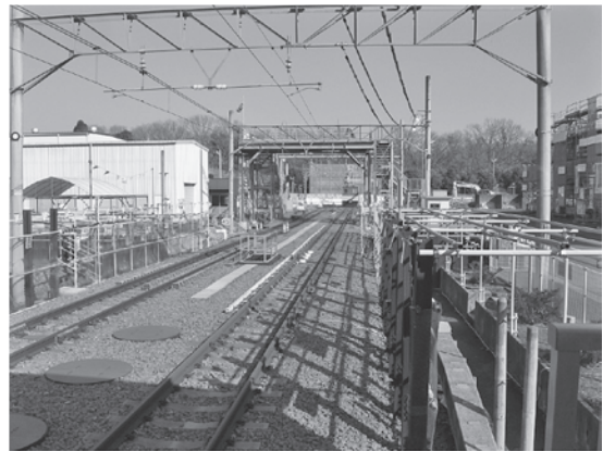
写真—5 複線 150 m の実習線

分岐器（ポイント）の切替を電動と、ハンドルによる手動で実際に行った。両方法とも、切り後確実に保持するための、ロック機構が順次作動する様になっている（写真—6）。