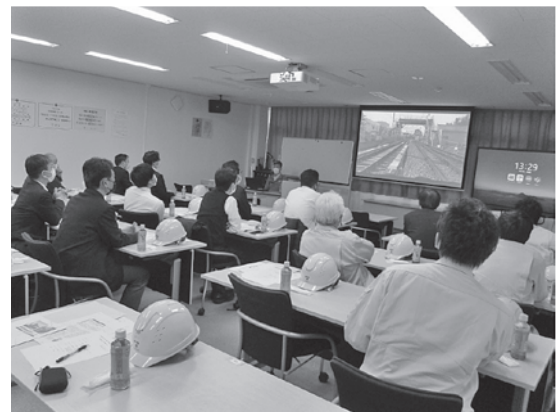
写真-1 会社概要などの紹介

施設内の研修ルームにて、当日の日程案内に続き鉄建建設(株)様の歴史、施工実績や会社概要などの紹介と、建設技術総合センターについてビデオにて紹介をして頂いた(写真-1)。また鉄建建設(株)様で開発さ