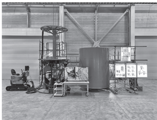
写真一2 Shinso-MaN 工法の全景

本工法のメリットは、作業環境の改善、安全性の向上、孔壁崩壊リスクの低減、周辺地盤変状リスクの低減、施工速度の向上などがあげられる。しかし、現状では刃口内の掘削アタッチメントや圧入ジャッキ、排土バケットなどは回収されるが、分解できない刃口などは、残置となる、今後はそれらの回収方法の検討を進めるそうだ。