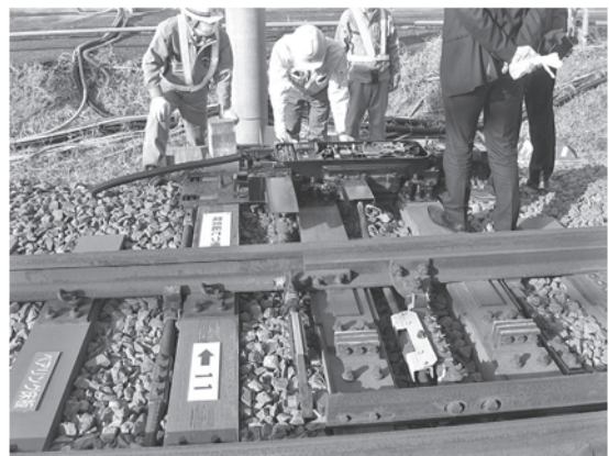
写真—6 分岐器（ポイント）