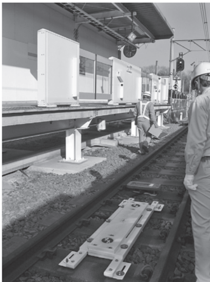
写真－8 車輪位置検知装置とホームドア

また、鉄道では、勾配は 1,000 分の 1 単位（パーミル）…、軌道がカーブする場合外側のレールを高くすることを、カントと呼ぶ…。などなど、お話を聞くたびに「へー…」と言う声が聞こえ、すぐに誰かに話したくなるような情報が盛沢山の実習線の見学だった。