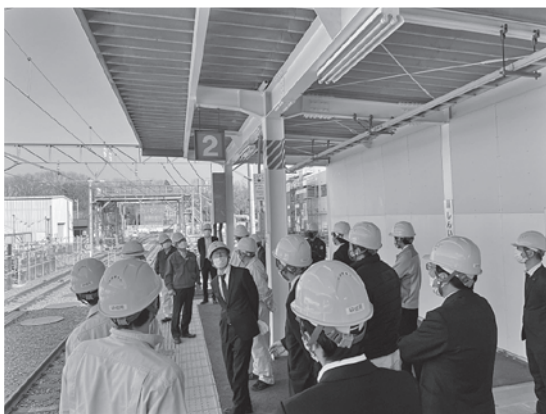
写真—4 非常停止ボタン

ホームの上では、電車の非常停止ボタンを操作し、各部の信号の作動と非常ベルの作動を確認した（写真—4）。非常停止ボタンは、赤白のトラマークがある柱に設置されているようで、これはJRも私鉄も同様とのこと。