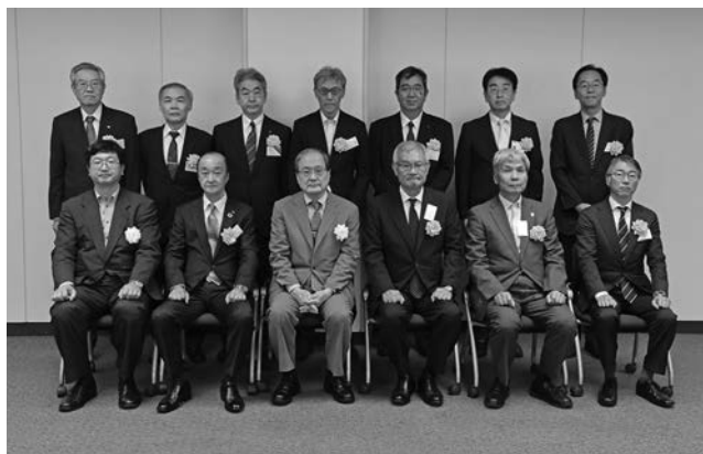
令和6年度永年会員表彰・永年役員表彰受賞者