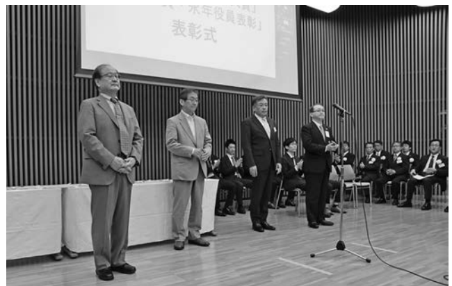
会長・副会長就任挨拶