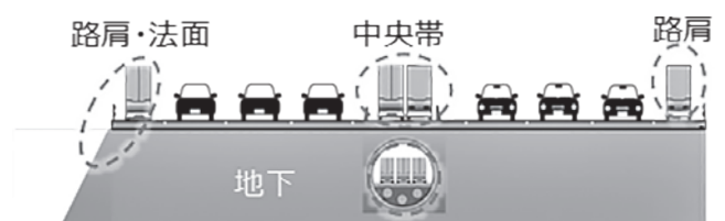
図—4 道路空間の利活用イメージ