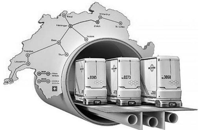
図-1 スイス地下物流システムのカートのイメージ