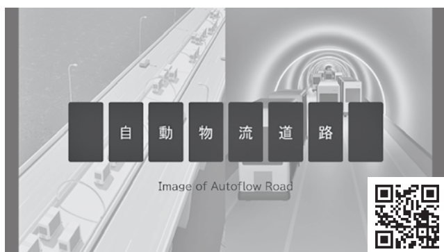
図—5 自動物流道路の構築に向けてのイメージ https://youtu.be/WQvOzAxu5Wo 上記の二次元コードからもアクセス可能