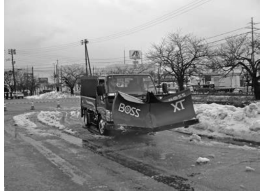
写真一 21 飛鳥特装(株) BOSS 社製スノーブラウ