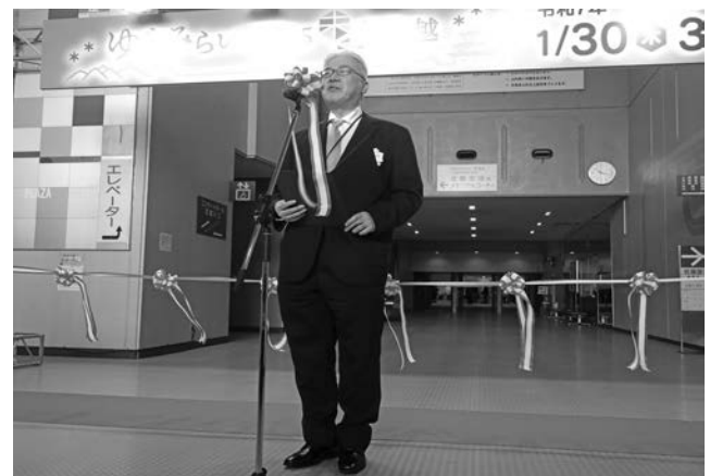
写真一 高松 北陸地方整備局長による開会挨拶

ゆきみらい 2025 in 上越のオープニングセレモニーでは、高松 国土交通省北陸地方整備局長（ゆきみらい 2025 in 上越 実行委員会委員長）による開会挨拶(写真一)に続き、来賓の皆さまと関係者によるテープカットが行われ賑々しく開会いたしました(写真二)。