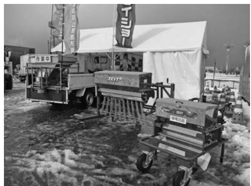
写真一二 (株)タイショー