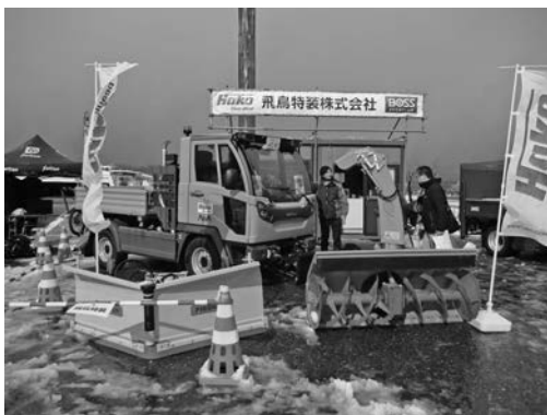
写真一九 飛鳥特装(株)