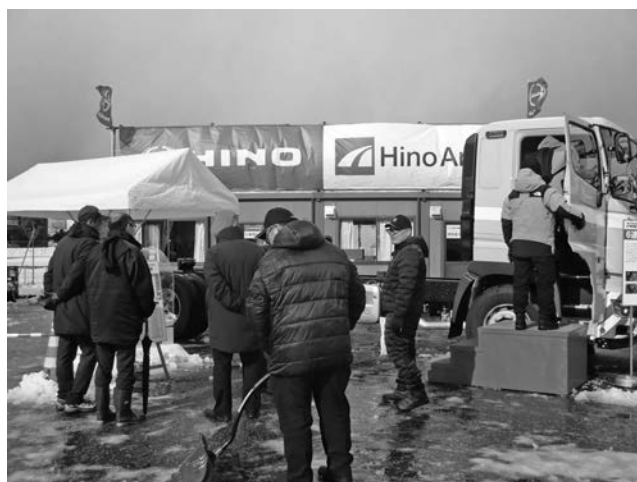
写真一 出展者ブースを見学する来場者①