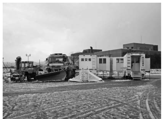
写真二〇 国土交通省 北陸地方整備局