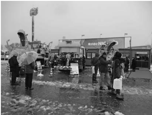
写真一五 (株) NICHIGO