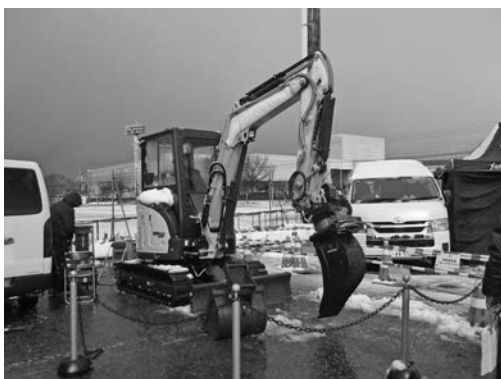
写真一一 KANEKO 重機(株)