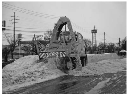
写真一 23 (株)NICHUJO ロータリ除雪車 (HTR308A)