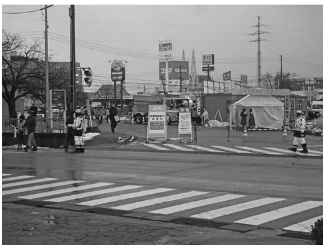
写真一 会場入り口