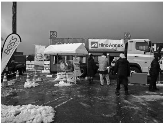
写真一七 日野自動車(株)