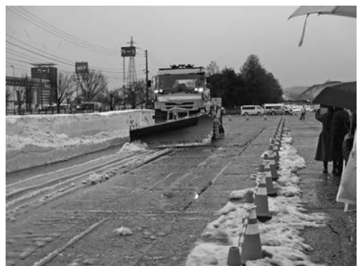
写真一 24 国土交通省 北陸地方整備局 北陸技術事務所 除雪トラック, 小形除雪車