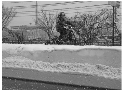
写真一 22 中日本高速オートサービス(株) 防災用 EV バイク (雪上バイク)