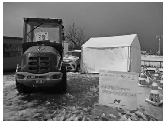
写真一八 メルコモビリティソリューションズ(株)