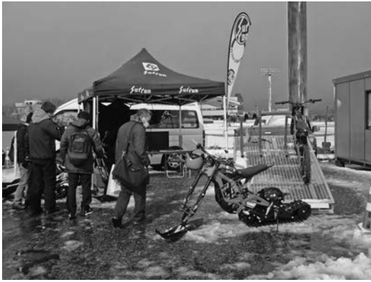
写真一三 中日本高速オートサービス(株)