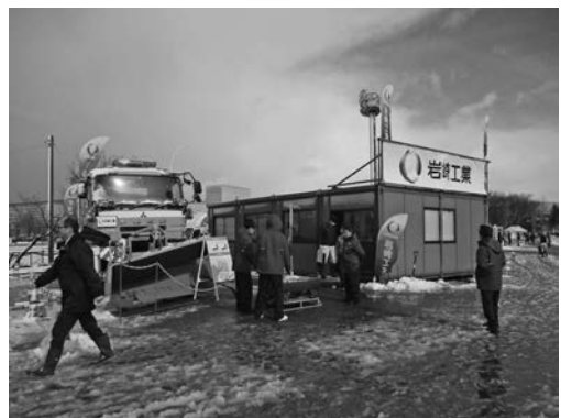
写真一〇 岩崎工業(株)