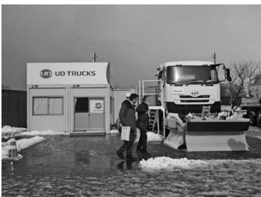
写真一九 UDトラックス(株)