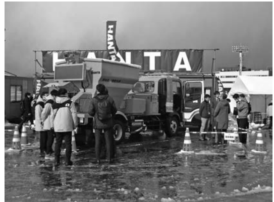
写真一六 範多機械(株)