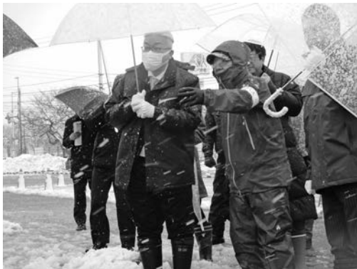
写真一七 説明を受ける高松北陸地方整備局長