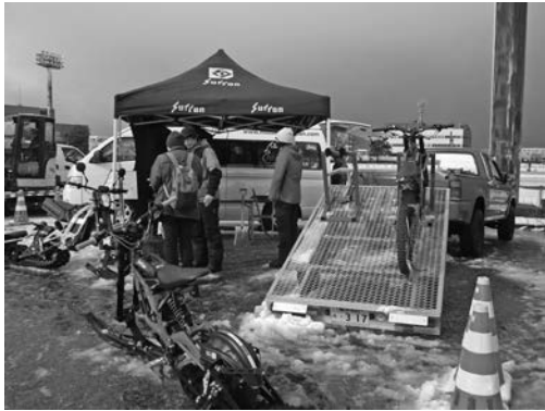
写真一五 出展者ブースを見学する来場者②