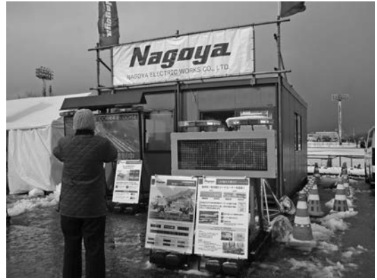
写真一四 名古屋電機工業(株)