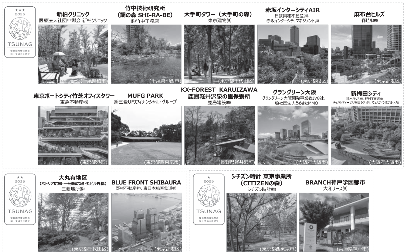
図一 2 2024 年度 TSUNAG 認定一覧 (14 件)