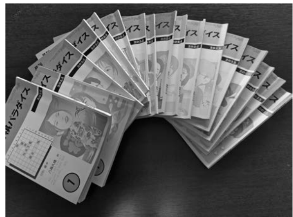
写真-3 毎月解答している詰将棋専門誌