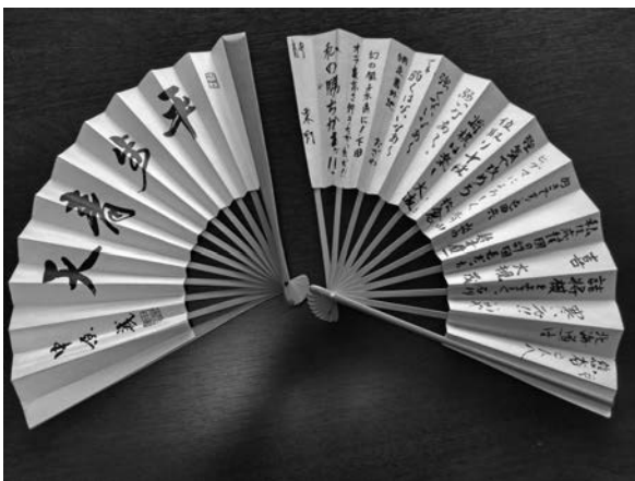
写真-1 大学卒業時に道場の席主から頂いた扇子と部員の寄せ書きの扇子