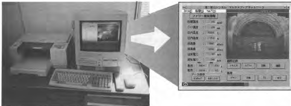
写真-1 マルチメディアパソコンとその画面

また、監視カメラは後方100m~200mに位置する換気架台上に電動雲台とともに設置されており、写真-2に見られるカメラコントローラから旋回運動、上下運動、ズーム（10倍）、ピントなどの遠隔制御が可能である。旋回角度は350度、上下角度は-70~+20度と幅広い制御が可能のため、切羽をはじめ、覆工作业など坑内の殆どの作業状況が確認できる。