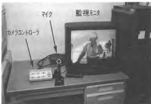
写真-2 監視モタ+カメラコントローラ+マイク

さらには、マルチメディアパソコンに表示される映像情報はフリーズ・キャプチャー機能により、デジタル情報として取り込むことができ、坑内環境情報やワープロ機能によって任意の情報を付加して作業記録として保存が可能となる。保存された情報は、いつでも必要時にアウトプットが可能となり、ペーパーレス作業に役立つ。その他、このシステムにビデオ装置を組み合わせることで必要な映像を録画し、その後に編集し提出書類の作成も可能である。