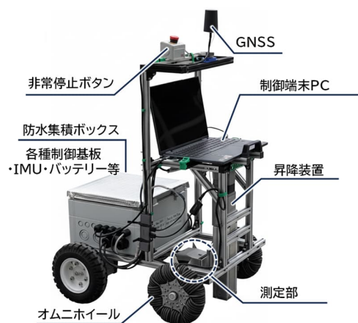
図ー3 自動測定ロボットの概要

本稿では、局所振動試験法、オートエンコーダおよび転移学習を用いた異常検知手法、そして自動測定ロボットを統合した RC 構造物の異常検知システムについて述べた。本システムは、従来、困難であった部材