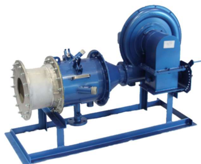
図2-1 水素バーナ（出力500kW）

日工では、これら3点の課題を解決し、水素燃料を安全かつ安定的に利用できる500kWの小型のバーナを開発した。（図2-1）