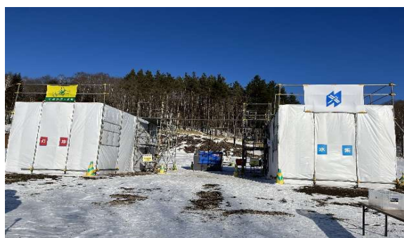
図3-2 実証試験の様子（陸別）

本実証試験は、国内で最も気温が低くなる陸別町（図3-2）の山間部と、幕別町の川辺の2か所で行い、寒冷地コンクリート養生の現場を想定した囲いの中で、ハイドロヒートと灯油を燃料とする従来ジェットヒーターを同条件で24時間連続稼働させて性能を比較した。