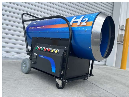
図5 開発したハイドロヒート

寒冷地実証試験により、ハイドロヒートは灯油ジェットヒーターと同様に温度を維持でき、水分による問題も確認されなかった。CN水素使用で温室効果ガス削減が確認できた一方、設置スペースや重量による利便性の改善が課題となった。今後は、これらを改善し、建設現場でのコンクリート養生、極寒地での採暖に計画的に導入することで建設現場でのCO 2 排出量の削減を実施していく予定である。