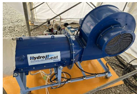
図3-1 ハイドロヒート試作機

温風用バーナに求められる30℃程度の温風を発生させるため、水素専焼ヒータ「Hydro H 2 eat(ハイドロヒート)」の開発を行った。（図3-1）