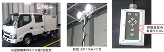
写真-1. 試作機（2灯LED×1.5kW×5.9m）外観