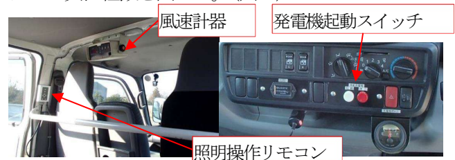
図-2. 小型照明車 車内

車両はダブルキャブを選定し、オペレータの休憩、資機材運搬等のスペースを確保し、また悪天候時に車内で照明操作ができるように操作リモコン及び風速計器、発電機起動スイッチを車内に設置したことでオペレータへの負担軽減を図った。（図-2）