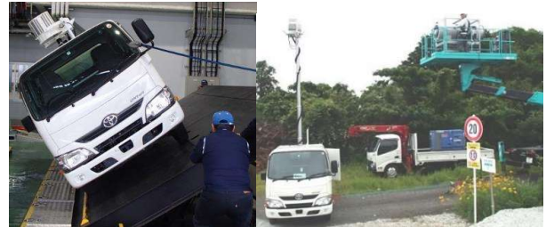
写真-2. 安定傾斜角試験（左）、風圧転倒試験（右）

強風下（風速 10m/s 以上）における車両安定性能確認のため、ジェットファンを用いて風速 14m/s かつ床面傾斜角 5 度下での安定性（車両揺れ最大 3mm）を確認し、アウトリガーレスで問題ない事を実証した。（写真-2）