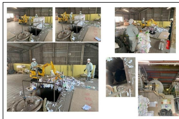
図・3 マイクロパワーショベル導入例

『また他業種においても導入効果が期待できるのではないかと。例えば農畜産業におけるビニールハウス内での畝づくりなどの作業には、今回導入したような小型機種であれば適性が高いのではないかと。さらに近年ではアニマルウェルフェアの観点から、養豚場や養鶏場といった畜産施設においても、内部での排ガス・騒音に対する対策が求められるようになっている。電動建機は、こうした課題解決に資する有効な手段となり得る。』