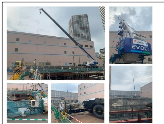
図-2 電動ラフテレーンクレーン稼働例

一方で、機械の運用面では、従来機であれば毎朝自社ヤードを出発し現場に自走し、夕方にヤードに帰着する。しかし、本機は公道走行時にバッテリーを多く消費するため、自走による往復移動ができず、現場に夜間留め置きとした。また、給油給電対応は、従来機は、現場やヤードにおけるパトロール給油などで補充できるが、電動建機の場合、日々の稼働を実現するには、現場で充電できる電源設備が必須であった。この現場では敷地条件や延長ケーブルの取り回し等の問題から、200V 充電設備 2 か所の追加仮設作業が発生した。