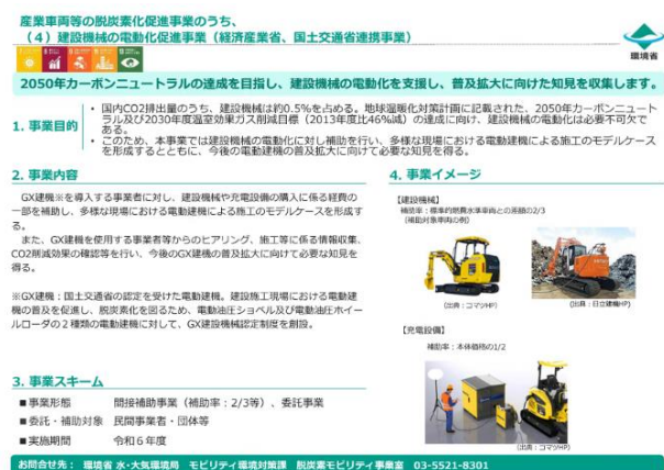
図-1 令和6年度 建設機械の電動化促進事業

このような背景を踏まえ、国土交通省が令和5年10月に建設機械認定制度の認定（GX建設機械認定制度）を創設した。環境省では国土交通省、経済産業省と連携して、令和6年度に「産業車両等における脱炭素化促進事業（建設機械の電動化促進事業）」を開始した。この事業は建設施工現場における電動建機の普及を促進し脱炭素化を図るため、GX建設機械認定制度で認定を受けた建設機械を導入する事業者に対し、建設機械や充電設備の購入に係る経費の一部を補助するものである。