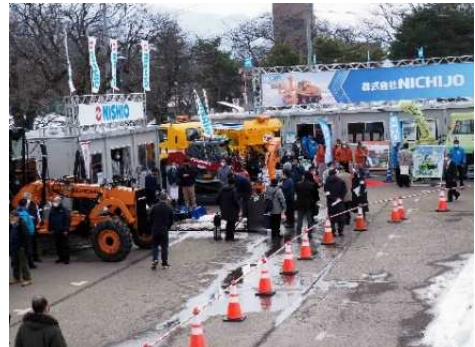
写真7 出展者ブースを見学する来場者 その3