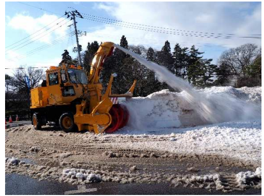
写真24・25 新潟トランス(株) ロータリ除雪車NR403