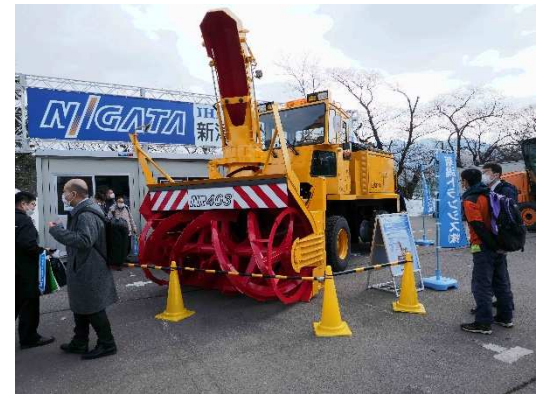
写真13 新潟トランス(株)