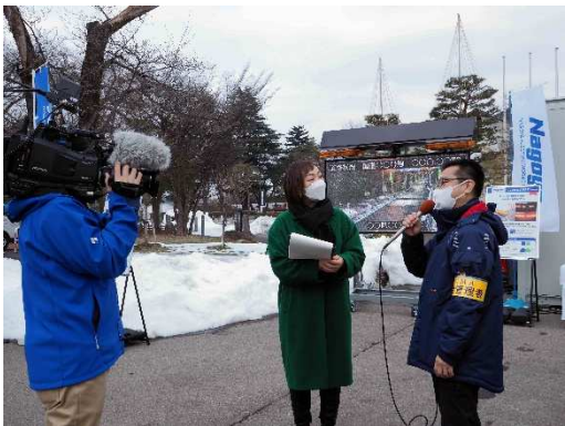
写真26 名古屋電機工業(株)のインタビュー状況