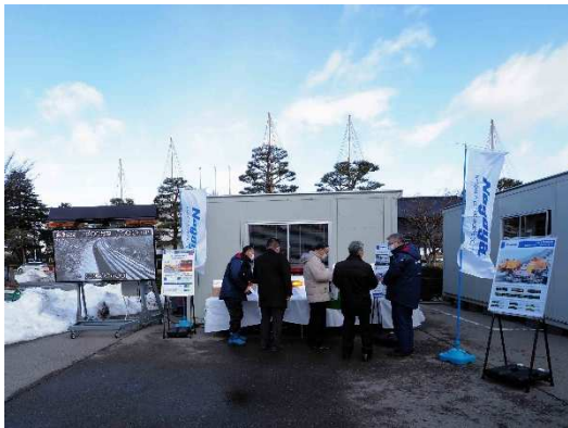
写真12 名古屋電機工業(株)