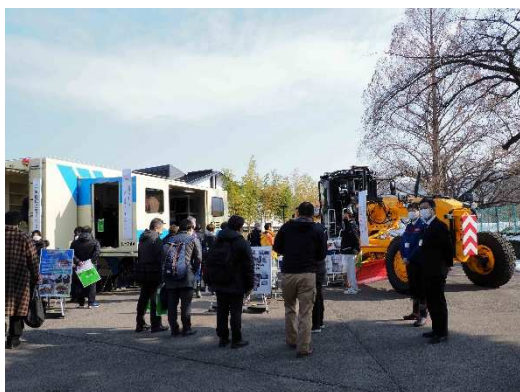
写真18 東北技術事務所