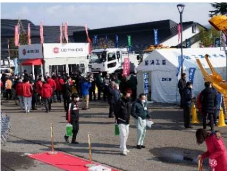
写真6 出展者ブースを見学する来場者 その2