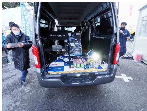
写真17 メルコモビリティソリューションズ(株)