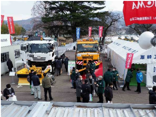
写真10 岩崎工業(株)・UDトラックス(株)