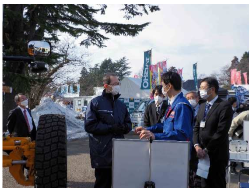
写真31・32 東北技術事務所の新型グレーダに試乗する内堀福島県知事