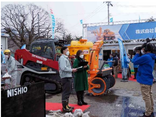
写真28 西尾レントオール(株)のインタビュー状況