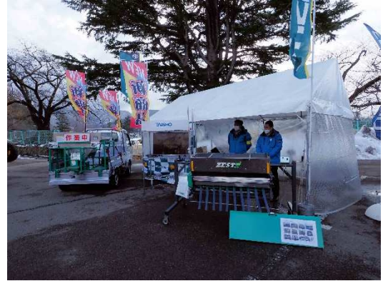
写真11 (株)タイショー