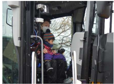
写真9 運転席で操作する親子