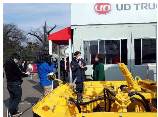
写真29 UDトラック(株)のインタビュー状況