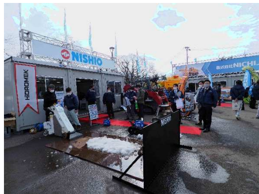
写真14 西尾レントオール(株)