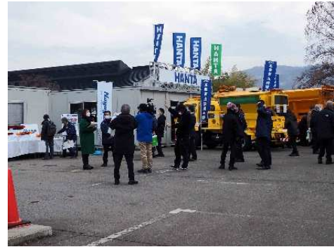
写真5 出展者ブースを見学する来場者 その1