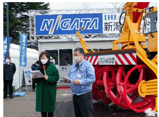
写真27 新潟トランス(株)のインタビュー状況