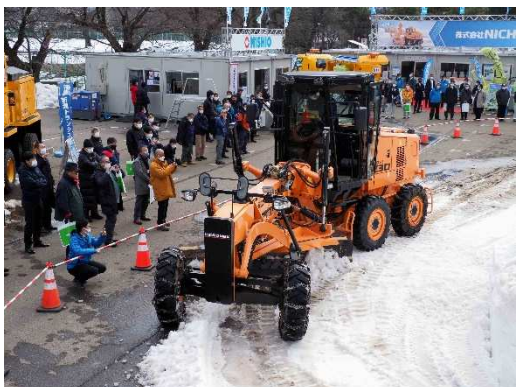
写真20 西尾レントオール(株) グレーダ MG230