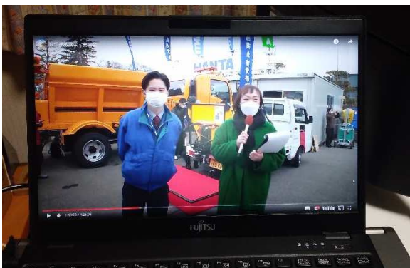
写真30 ライブ配信(YouTube)視聴状況