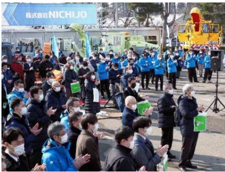
写真4 オープニングに集まった来場者