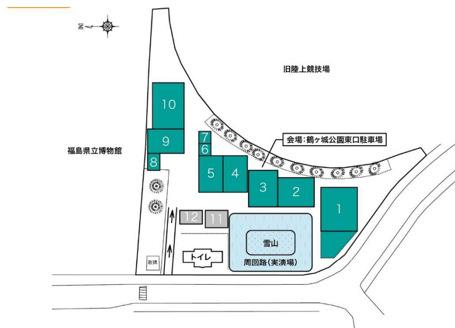
図1 ブース配置図と出展会社名