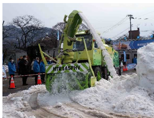
写真23 (株)NICHIGO プラグインハイブリッドロータリ除雪車 HTR145PHV