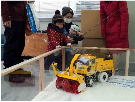
写真8 ラジコン模型で遊ぶ親子