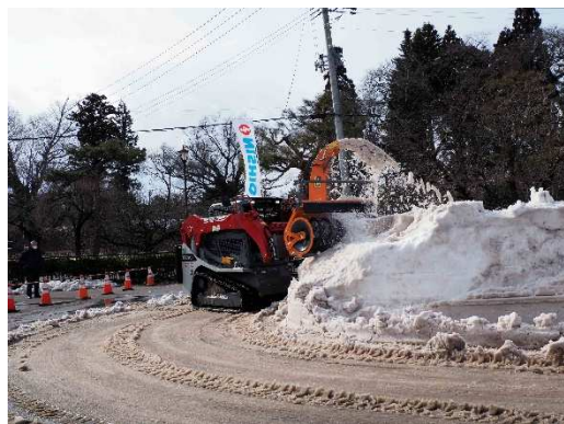
写真21 西尾レントオール(株)トラックローダ TL10V