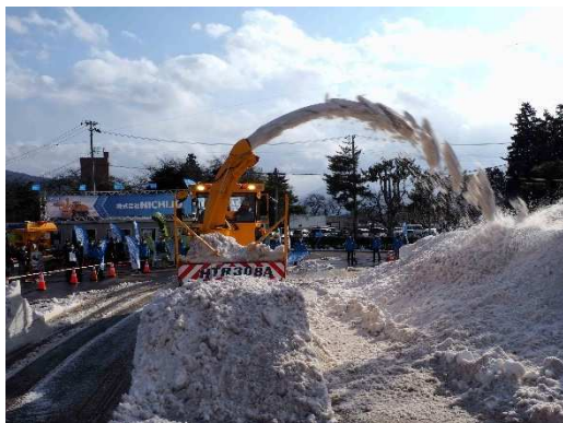
写真22 (株)NICHIGO ロータリ除雪車 HTR308A