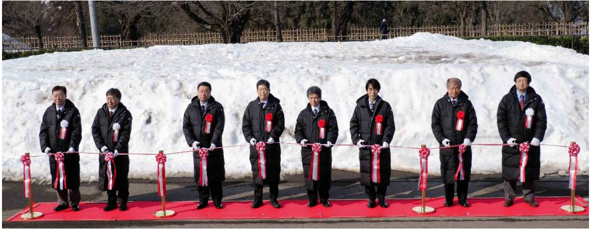
写真3 来賓、関係者によるテープカット