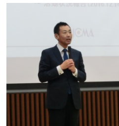
写真5 四家副推進本部長