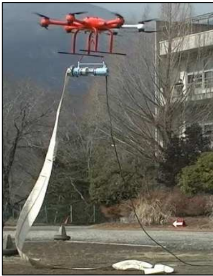
写真一3 ドローンによる運搬