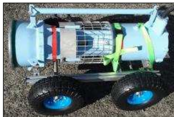
写真一2 台車とポンプを固定

投入斜面にもコンクリートや草の生い茂った場所があり、どの場所にも対応したものを検討中である。