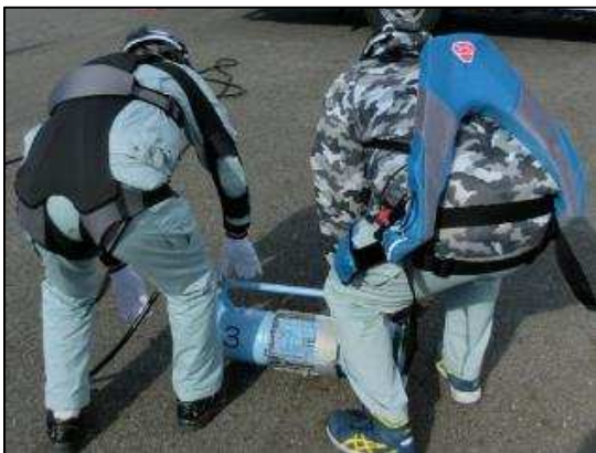
写真一4 PASによるポンプ運搬