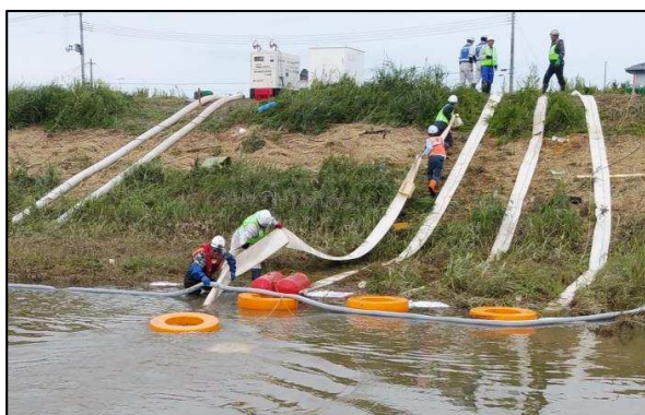
写真一1 排水ポンプ投入現場