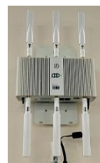
写真-2 多機能型無線アクセスポイント