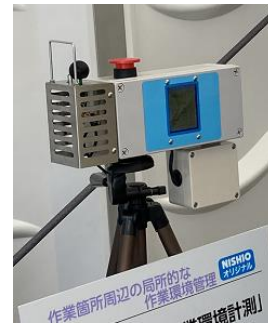
写真-4 ポータブル型作業環境計測

それぞれの建設現場の、環境やニーズに応じて腕時計型ウェアラブル端末を使用するか、ポータブル型作業環境計測を使用するか、あるいは両方を併用するといった選択が可能となる。