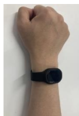
写真-1 ウェアラブル端末

多機能型無線アクセスポイントは、メッシュ無線 LAN に対応しており、アクセスポイント同士が無線接続可能なため、建設現場内一体に WiFi 環境を提供する目的としても活用しやすく、図面や検査記録のクラウド共有や、遠隔臨場などのニーズの拡大に伴い、これらと共用できるメリットがあると考えます。