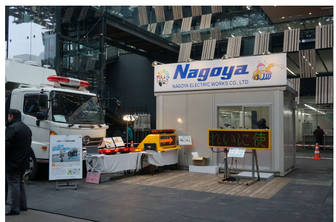
名古屋電気工業(株)