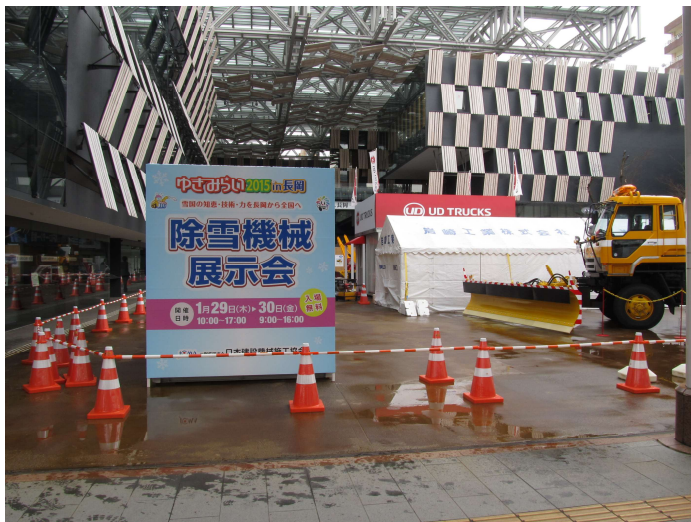
除雪機械展示会 会場 (長岡市 アオーレ長岡)

※ 他にゆきみらいシンポジウム、ゆきみらい研究発表会、ゆきみらい見本市・物産展・飲食展」が開催されました。