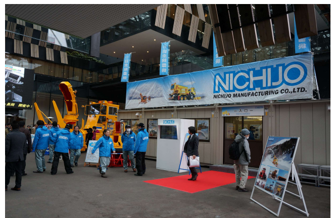
(株)日本除雪機製作所