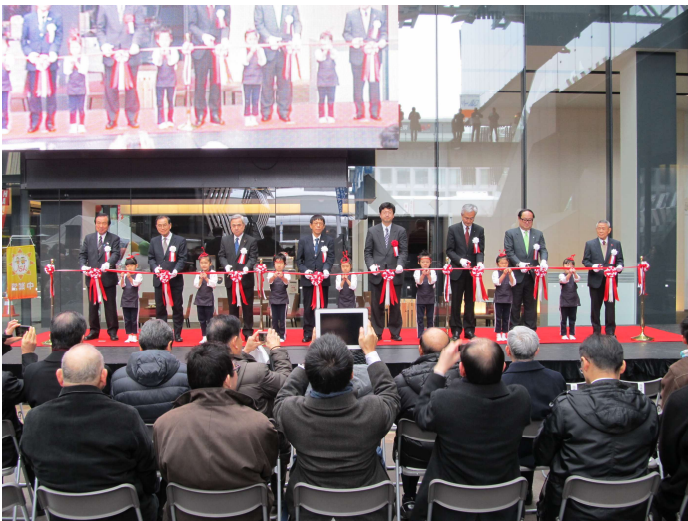
テープカット(写真左より)

(公社)新潟県観光協会 会長 (一社)日本建設機械施工協会 会長 新潟県 副知事 国土交通省 北陸地方整備局長 国土交通省 総合政策局 公共事業企画調整課 施工安全企画室長 長岡市 副市長 (一社)新潟県建設業協会 会長 (一社)長岡観光コンベンション協会 会長