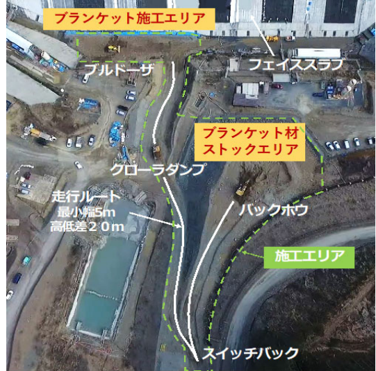
写真-1 無人化施工状況全景

加えて、専門知識を要しないユーザーインターフェースおよび汎用性の高い協調制御技術により、現場導入・運用を容易にし、将来的な普及を見据えた実装性の高い技術として確立した。