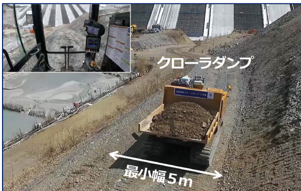
写真-2 自動化クローラダンプ運搬状況

専門知識を要しないユーザーインターフェースを採用するとともに、T-iCraftを介して自社開発機のみならず他社製無人化建機を含めた協調制御を可能とした。これにより、現場導入・運用を容易にするとともに、継続的な無人化施工の実施を可能とし、将来的な普及に資する実装性を確保した。