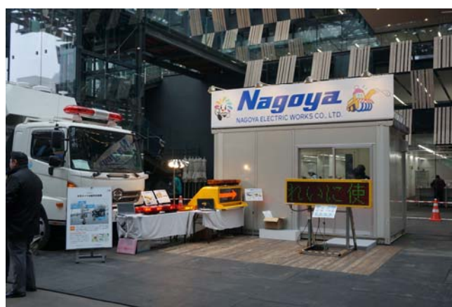
名古屋電気工業(株)