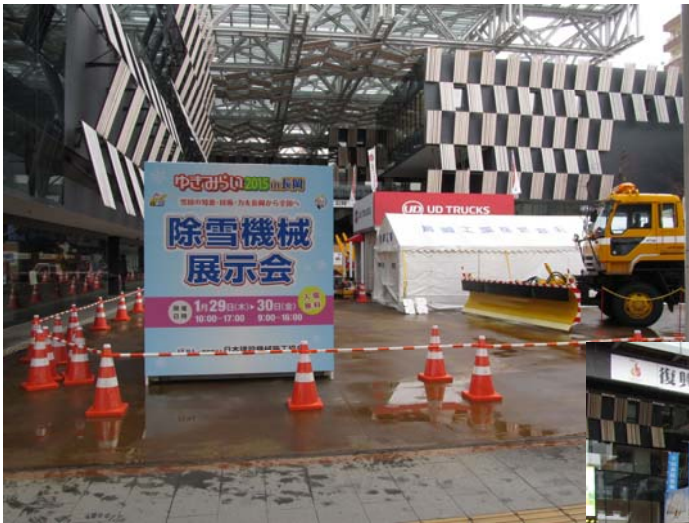
除雪機械展示会 会場 (長岡市 アオーレ長岡)

※ 他にゆきみらいシンポジウム、ゆきみらい研究発表会、ゆきみらい見本市・物産展・飲食展」が開催されました。