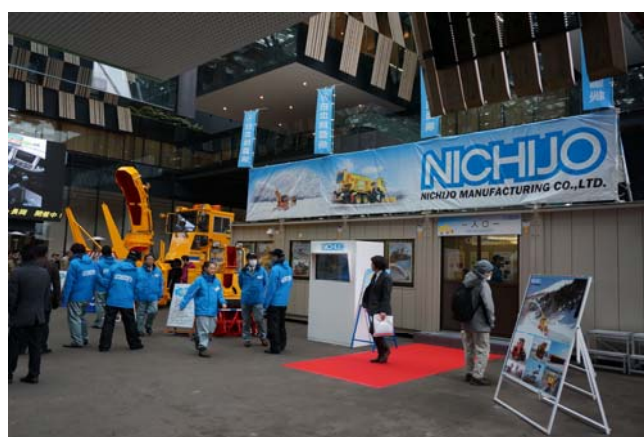
(株)日本除雪機製作所