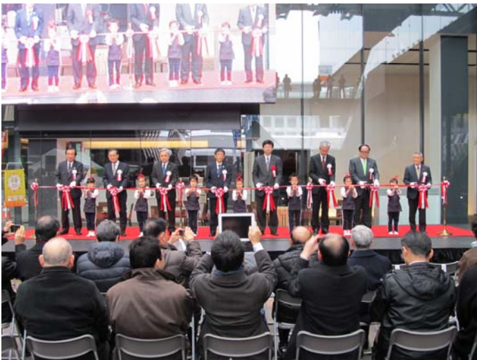
テープカット(写真左より)

(公社)新潟県観光協会 会長 (一社)日本建設機械施工協会 会長 新潟県 副知事 国土交通省 北陸地方整備局長 国土交通省 総合政策局 公共事業企画調整課 施工安全企画室長 長岡市 副市長 (一社)新潟県建設業協会 会長 (一社)長岡観光コンベンション協会 会長