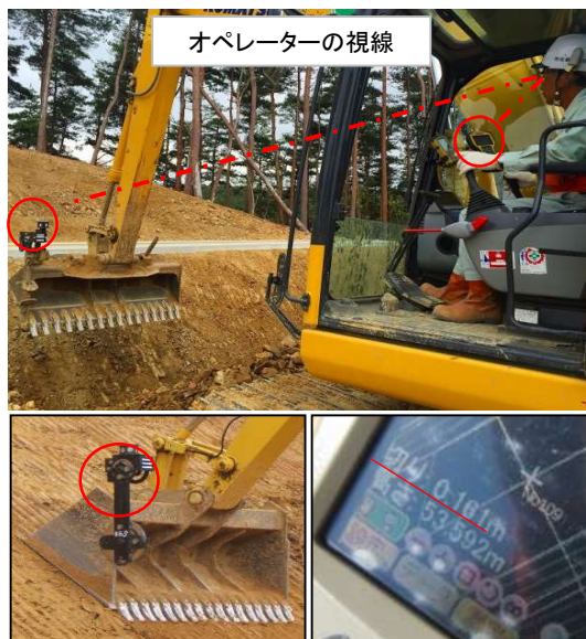
バケットの角度は勾配目視装置で確認